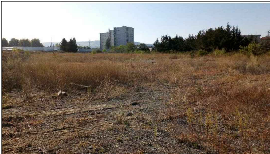
PC 7 : Photographie proche