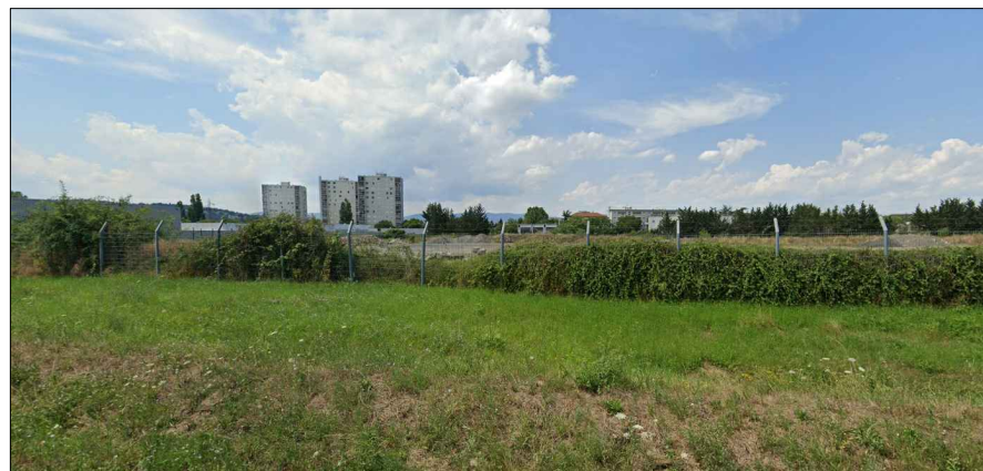
PC 8 : Photographie lointaine

Le présent projet est situé sur la commune de VILLEFRANCHE - 69400, Rue Gabriel Voisin. Le terrain fait partie du Parc d'activités Lagune Sud. L'accès au site s'effectue par: