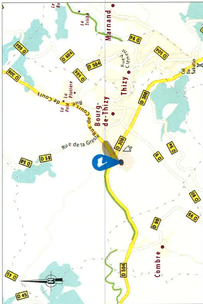
PLAN DE SITUATION - Ech: 1/20 000