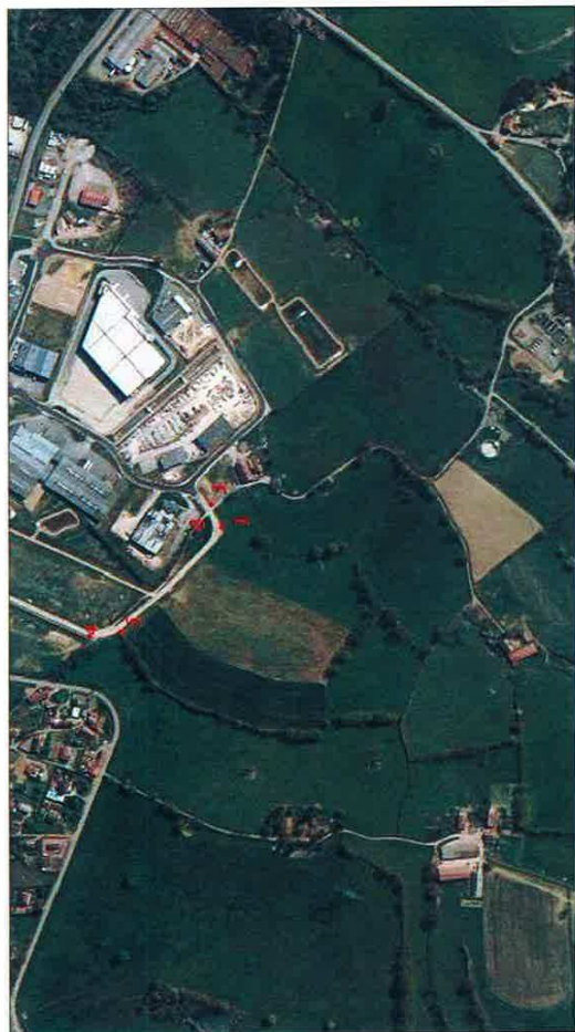
PHOTOGRAPHIE AERIEENNE DU TERRAIN