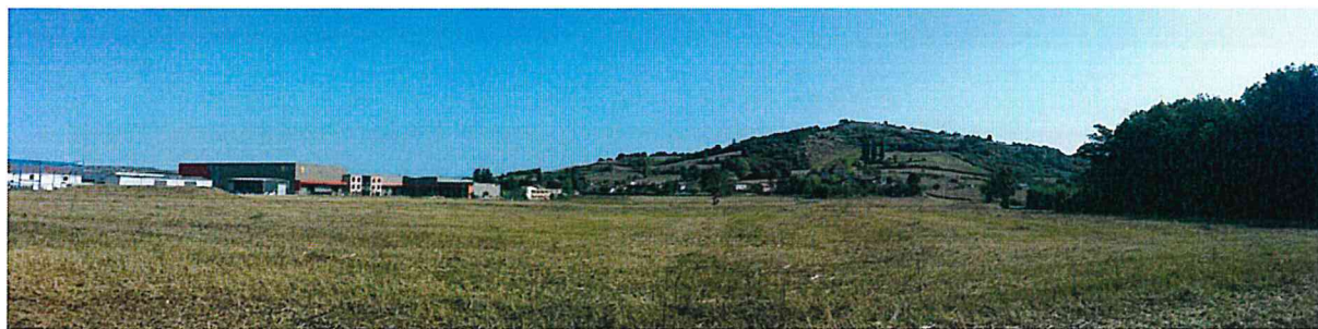
Prise de vue n°3 (EcoStratégie – 20/09/2019)