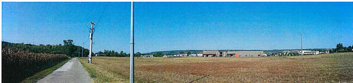
Prise de vue n°4 (EcoStratégie – 20/09/2019)