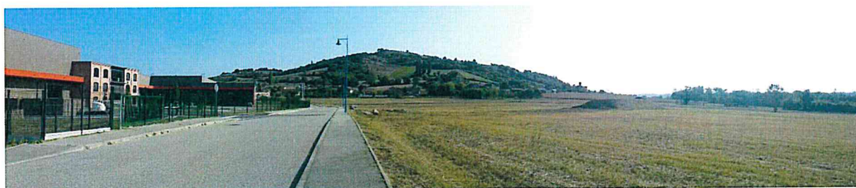
Prise de vue n°1 (EcoStratégie – 20/09/2019)