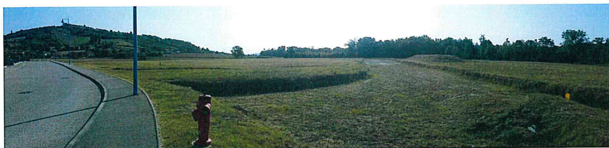
Prise de vue n°2 (EcoStratégie – 20/09/2019)