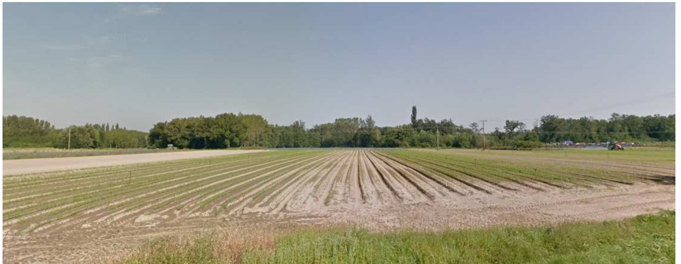
3) Vue depuis la RD 1 en direction du projet vers le Nord (streetview aout 2013)