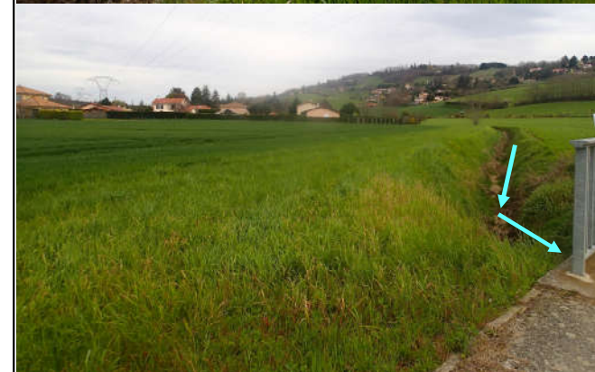
Stabilisation du lit par génie végétal