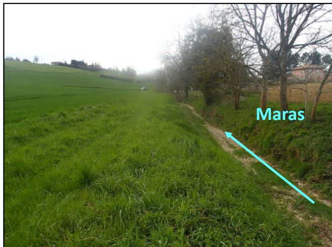
Emplacement bassin de stockage