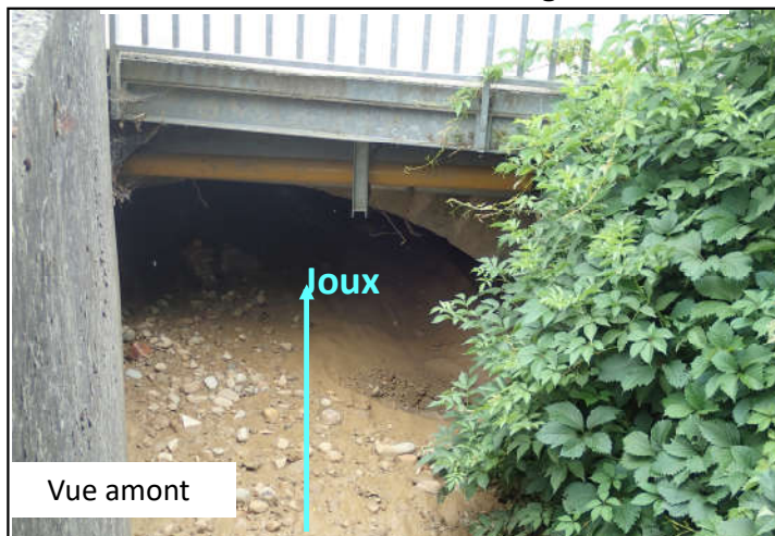
Pont rue des Allobroges