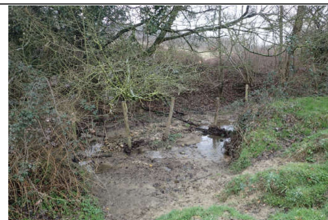
Seuils de stabilisation en génie végétal