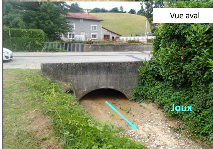
Renaturation le long de la route de Serpaize