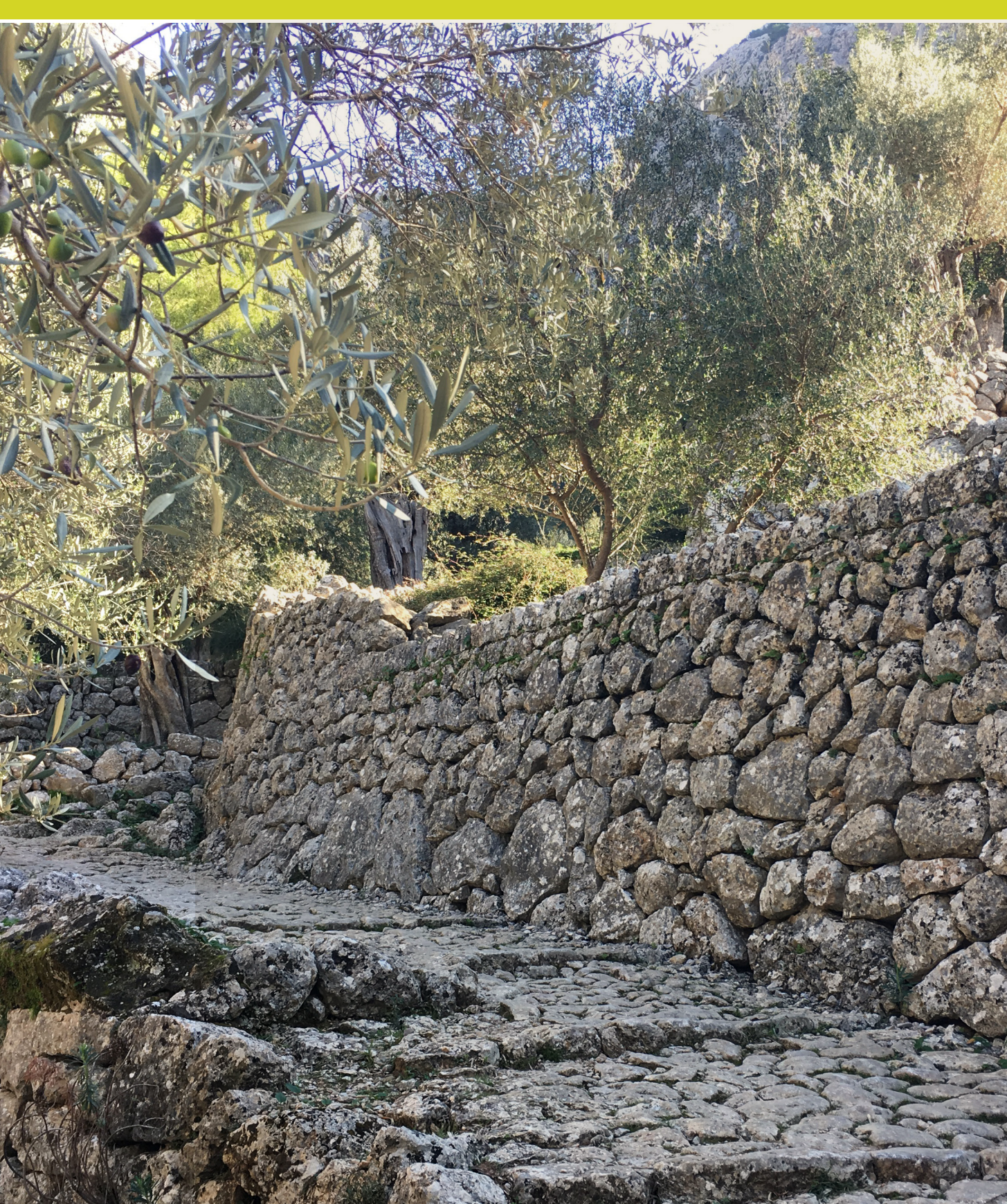
Cheminement et terrasses agricoles en pierre sèche à Majorque

La pierre sèche assure également le maintien d'une économie locale en créant des emplois non industrialisés et non délocalisables dans la construction et la maintenance des ouvrages existants.