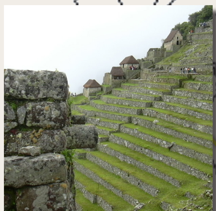
Machu Picchu 1996