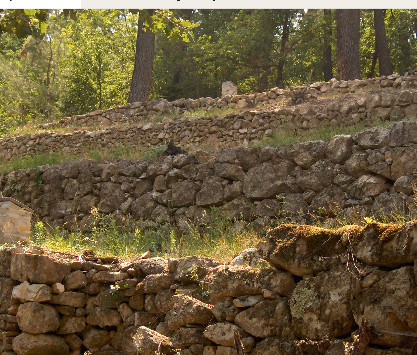
Terrasses agricoles à Ailhon