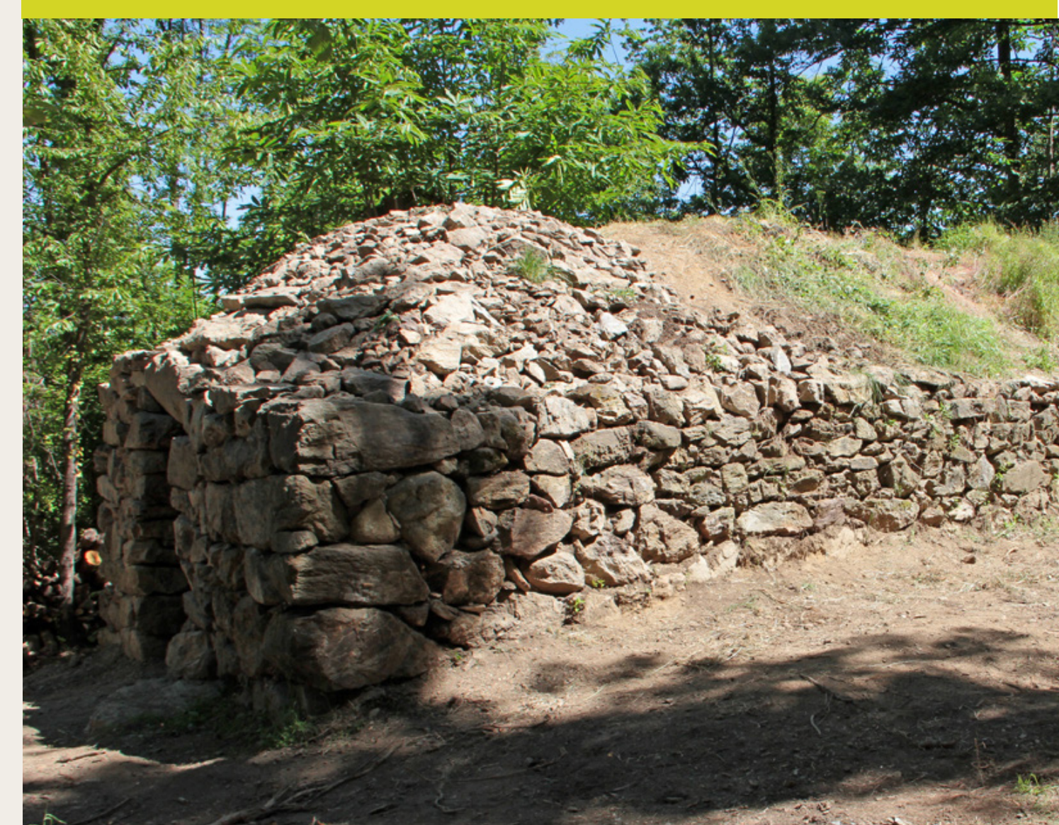
Cortal du Clôt del Baladre