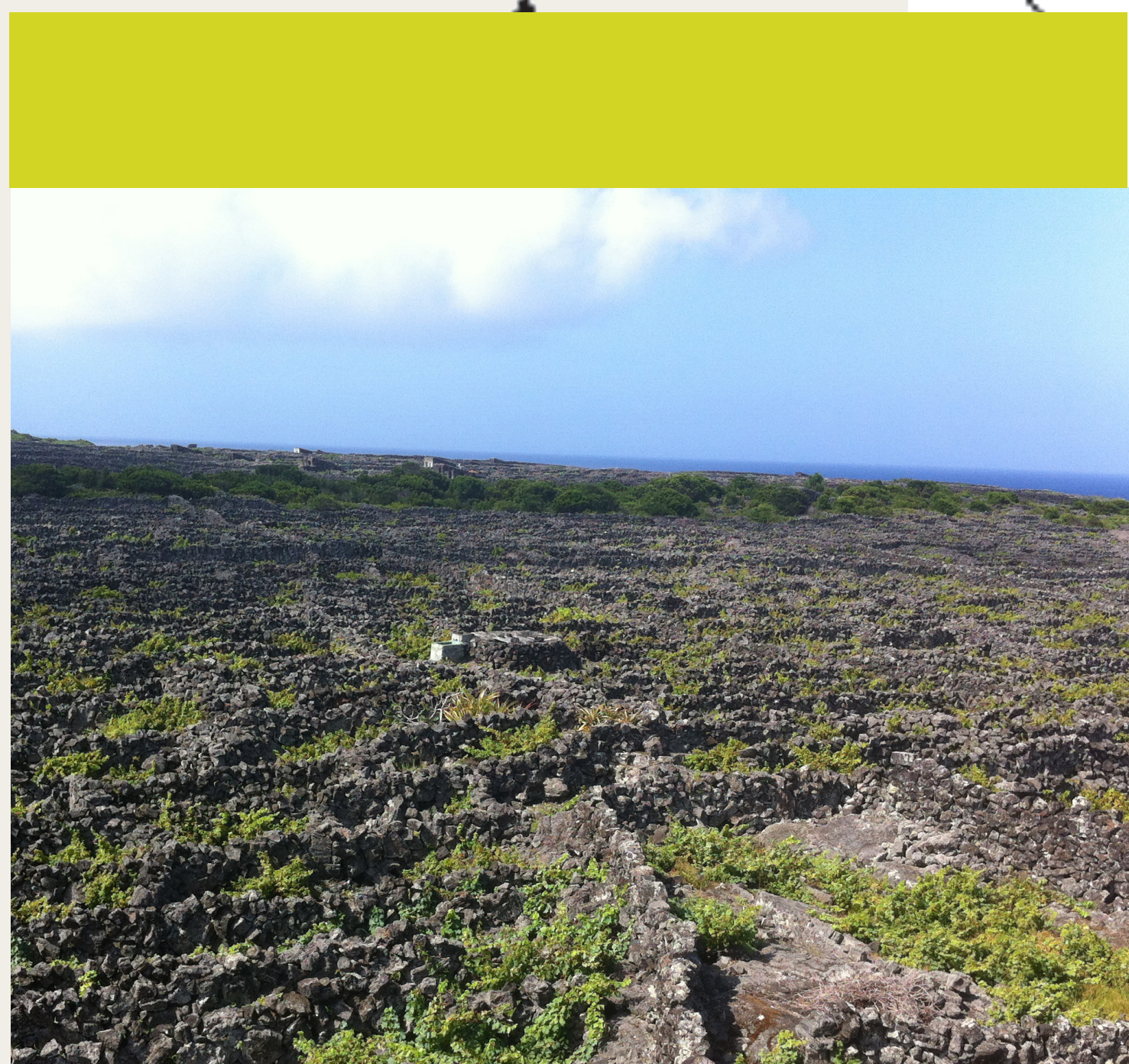
Ile de Pico - 2004

Le savoir-faire est inscrit au patrimoine mondial en 2018