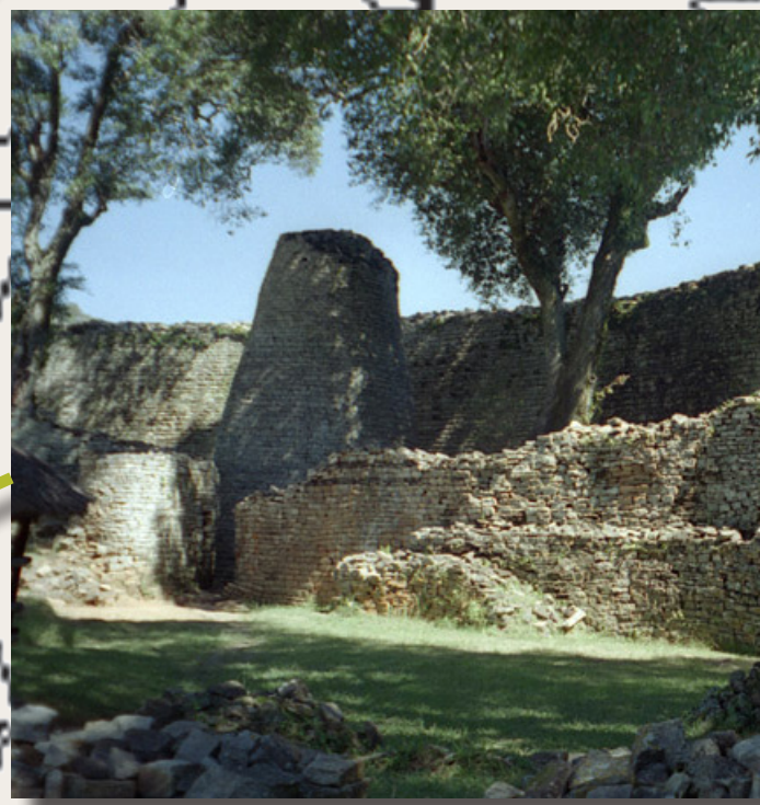
Grand Zimbabwe - 1986

BIBLIOTHÈQUE MICHEL SERRES ÉCOLE CENTRALE LYON