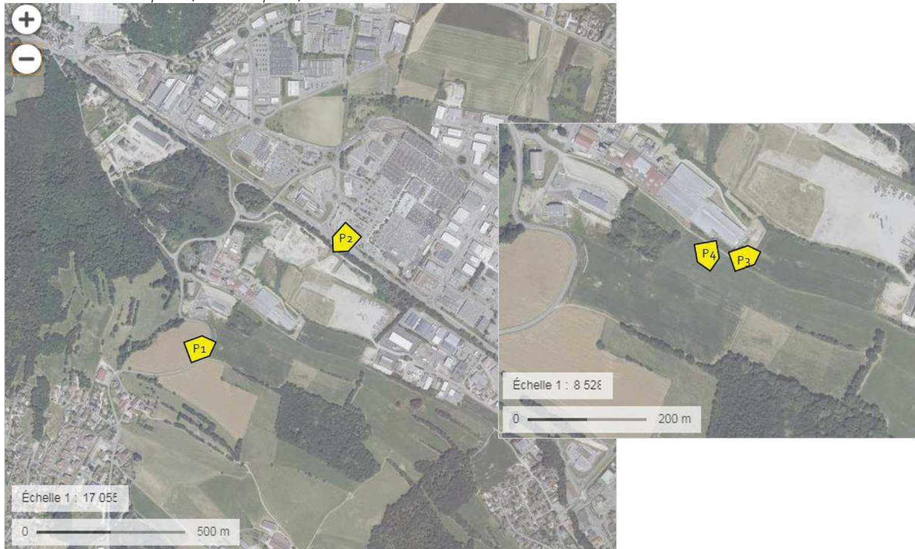
Carte 2 Localisation des photos