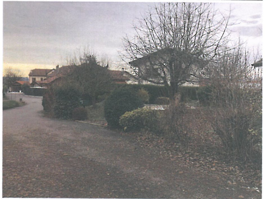
VUE 4: Environnement proche (17/12/2019)