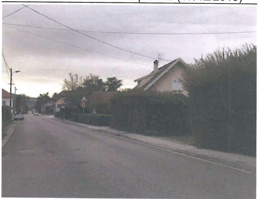
VUE 6: Paysage lointain (17/12/2019)