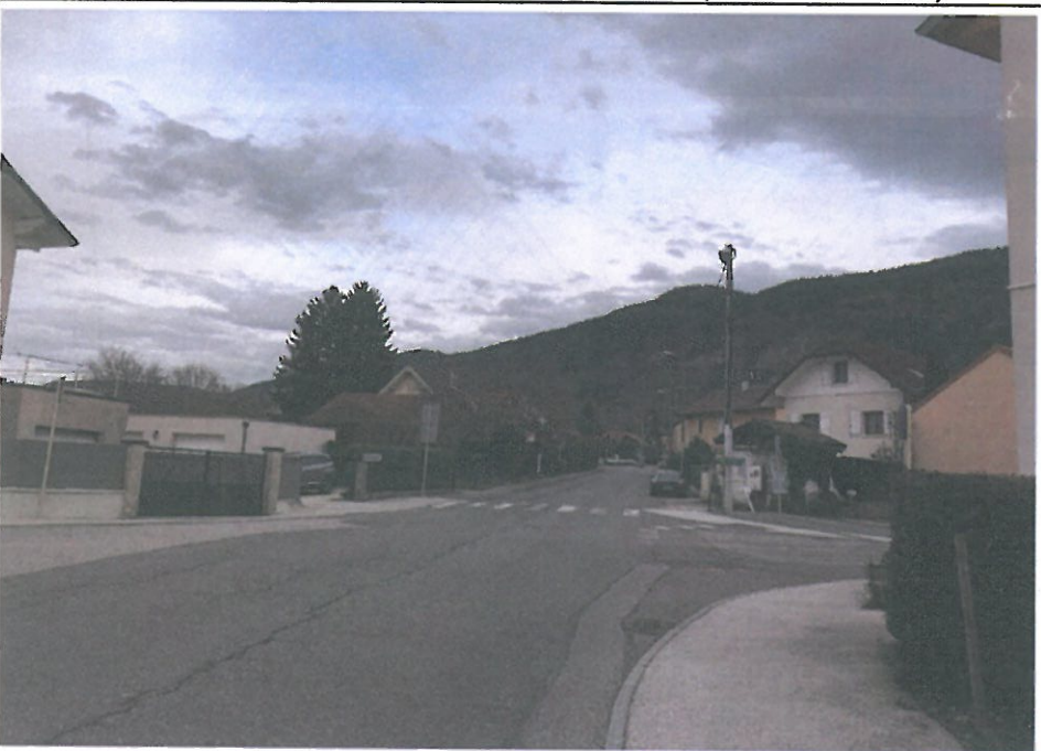
VUE 5: Paysage lointain (17/12/2019)