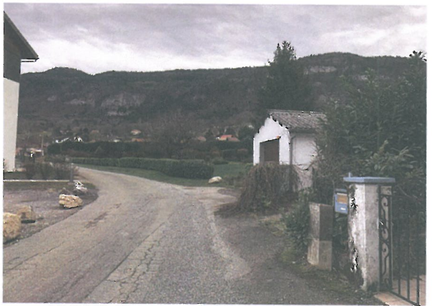
VUE 2: Paysage lointain (17/12/2019)