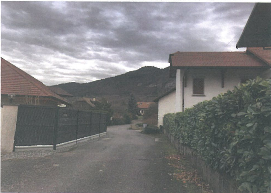
VUE 3: Environnement proche (17/12/2019)