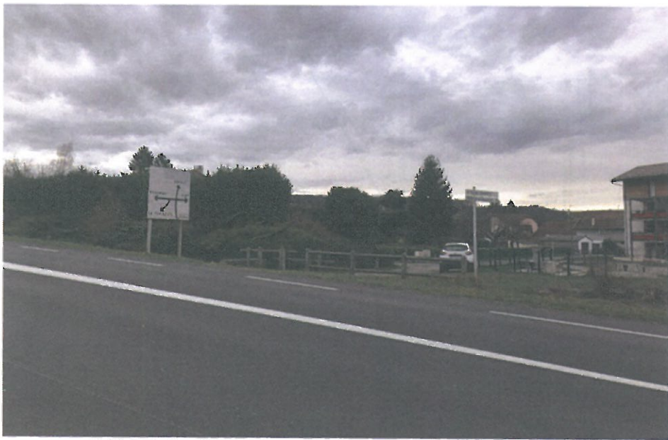
VUE 1: Paysage lointain (17/12/2019)