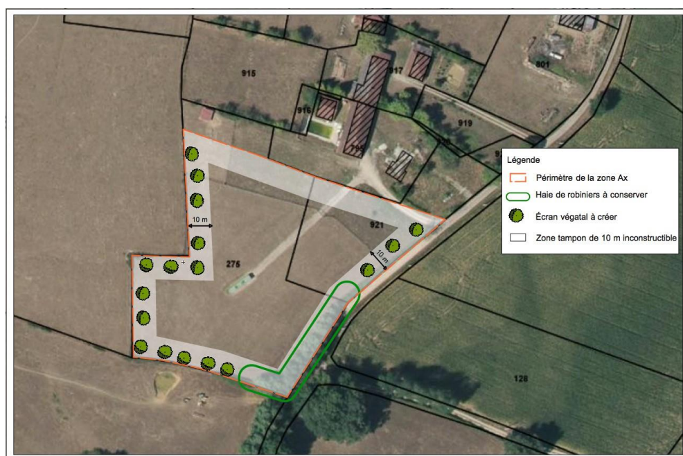
ILLUSTRATION DES PRINCIPES APPLICABLES À LA ZONE Ax

Informations complémentaires concernant les éléments nécessaires à mettre en œuvre pour le projet :