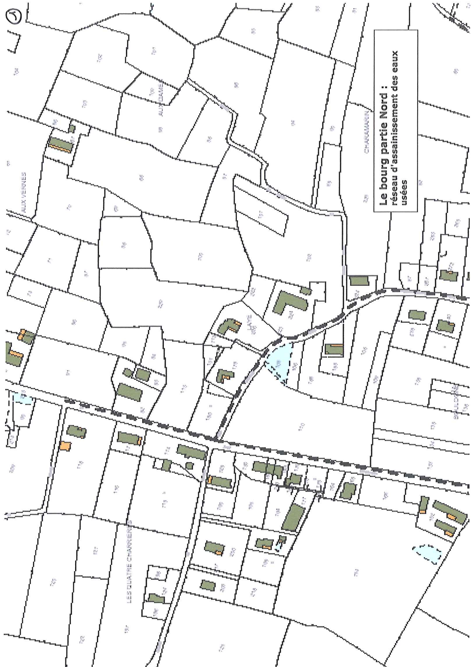
Le bourg partie Nord : réseau d'assainissement des eaux usées