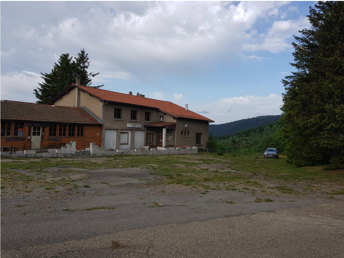
P2 PHOTOGRAPHIE DU BATIMENT EXISTANT ET DE SES ABORDS ( DATÉ DU 23/05/2022)