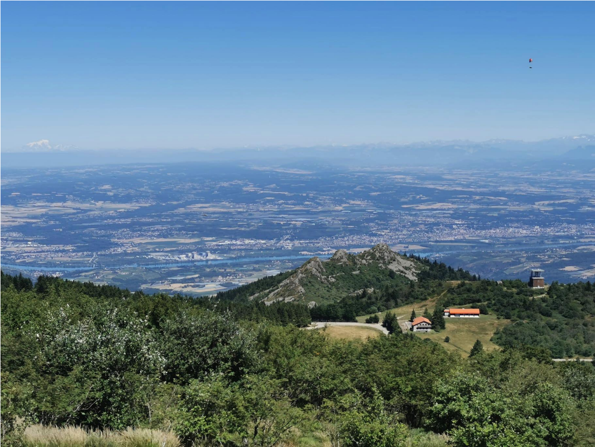
P1 PHOTOGRAPHIE DES BATIMENTS EXISTANTS ET DE LA PARCELLE VU DU CRET DE LA BOTTE ( DATÉ DU 13/12/2022)

COORDONNEES CARTOGRAPHIQUES DU PROJET : 45°23'19"N 4°36'57"E