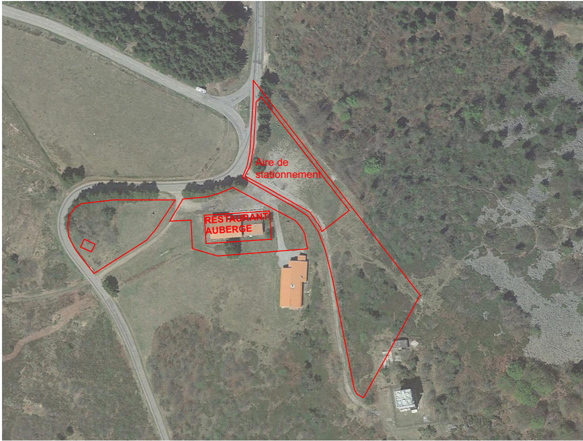
VUE AERIENNE 1/2500e

COORDONNEES CARTOGRAPHIQUES DU PROJET : 45°23'19"N 4°36'57"E