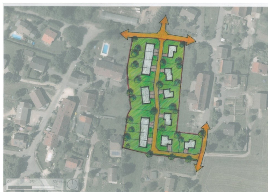
Schéma illustratif sans valeur réglementaire

Le coût des déplacements de la ligne MT et de la canalisation d'eau potable devra être intégré dans le programme des travaux d'aménagement de la zone.