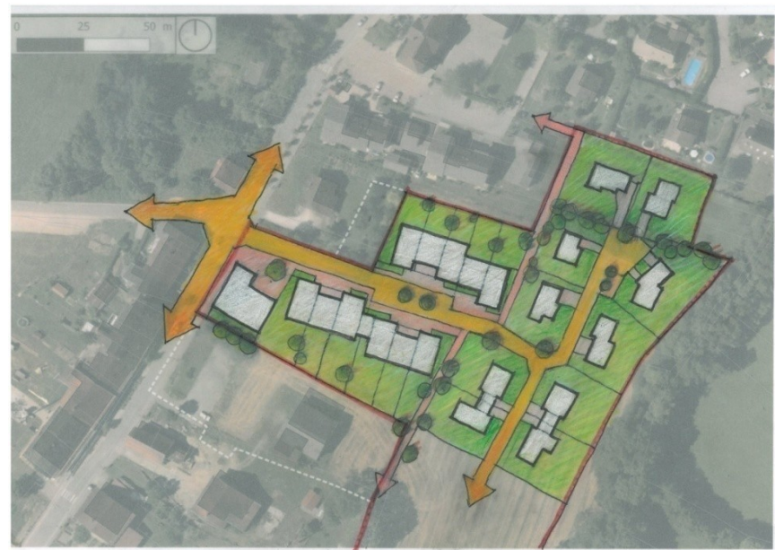
Schéma illustratif sans valeur réglementaire

La première tranche, située en entrée de zone, depuis la route de Novéry, pourra accueillir des commerces, des services, des bureaux et des équipements publics ou d'intérêt collectif en cohérence avec le projet de renforcement du pôle de centralité du Chef-Lieu.