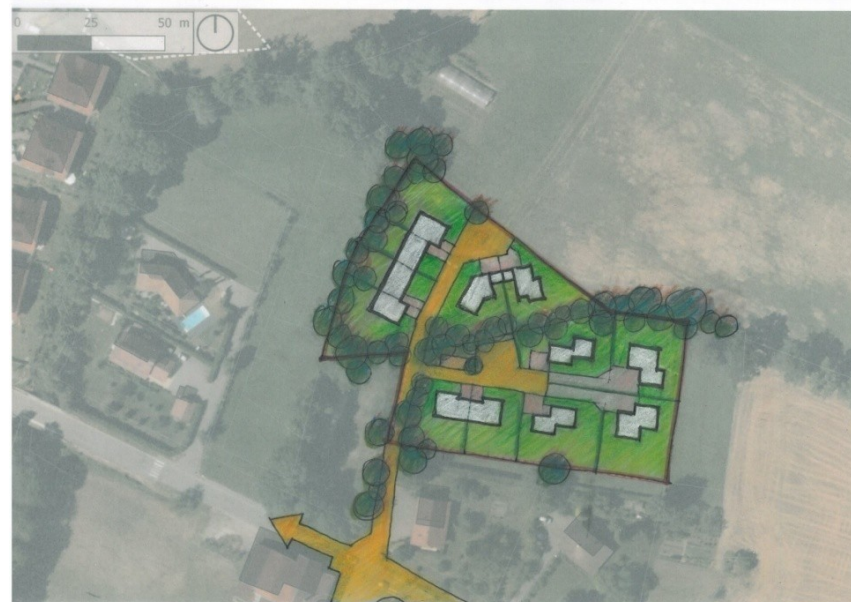
Schéma illustratif sans valeur réglementaire

L'opération pourra être réalisée en deux tranches. Le boisement existant traversant le site d'Ouest en Est constituera la limite entre les tranches.