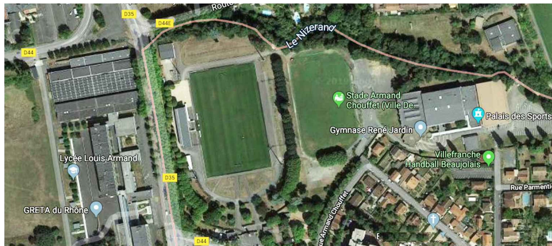
Photo aérienne - 1/2200