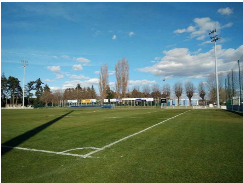
3 - Photographie depuis l'emplacement du auvent de la buvette vers le stade d'honneur