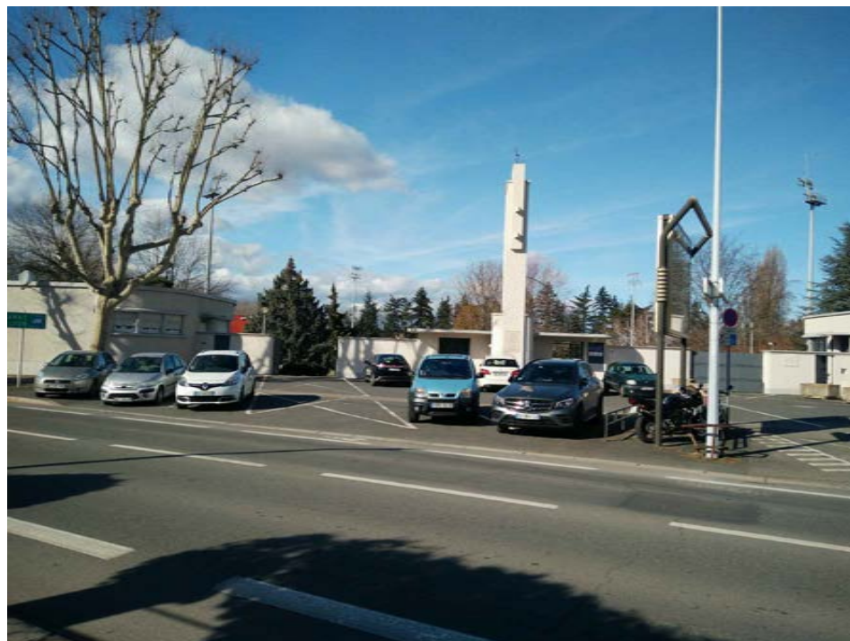
1 - Photographie de l'entrée principale du Stade ARMAND CHOUFFET à Villefrance-sur-Saône