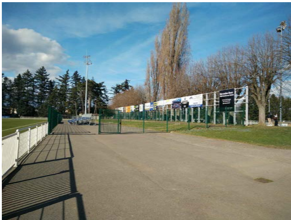
5 - Photographie de l'emplacement de la futur dalle pour la tribune démontable et de l'espace réceptif