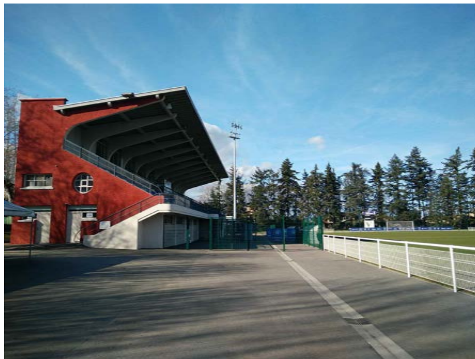
4 - Photographie de l'emplacement du auvent de la buvette proche de la tribune principale