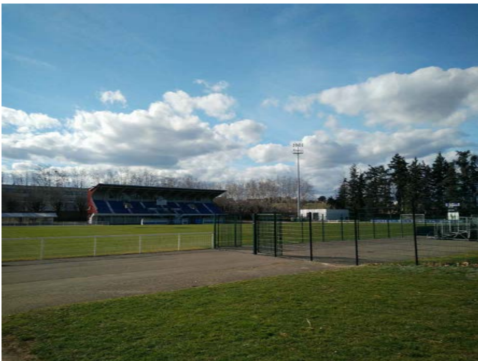
6 - Photographie depuis l'emplacement de l'espace réceptif