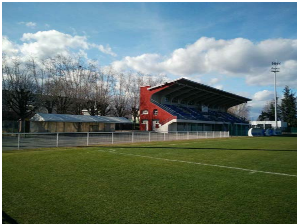
2 - Photographie de l'emplacement du auvent de la buvette proche de la tribune principale depuis le stade d'honneur