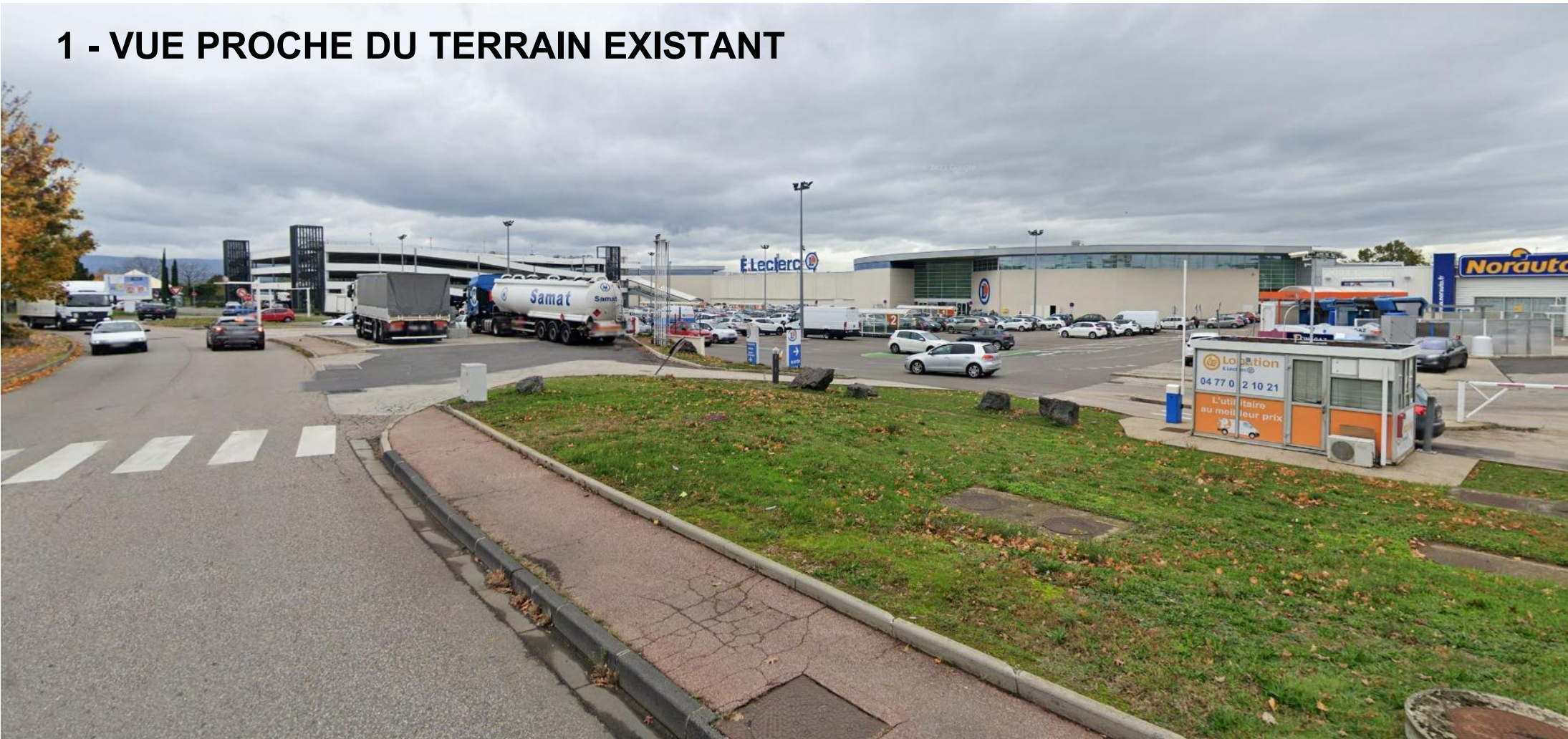
1 - VUE PROCHE DU TERRAIN EXISTANT