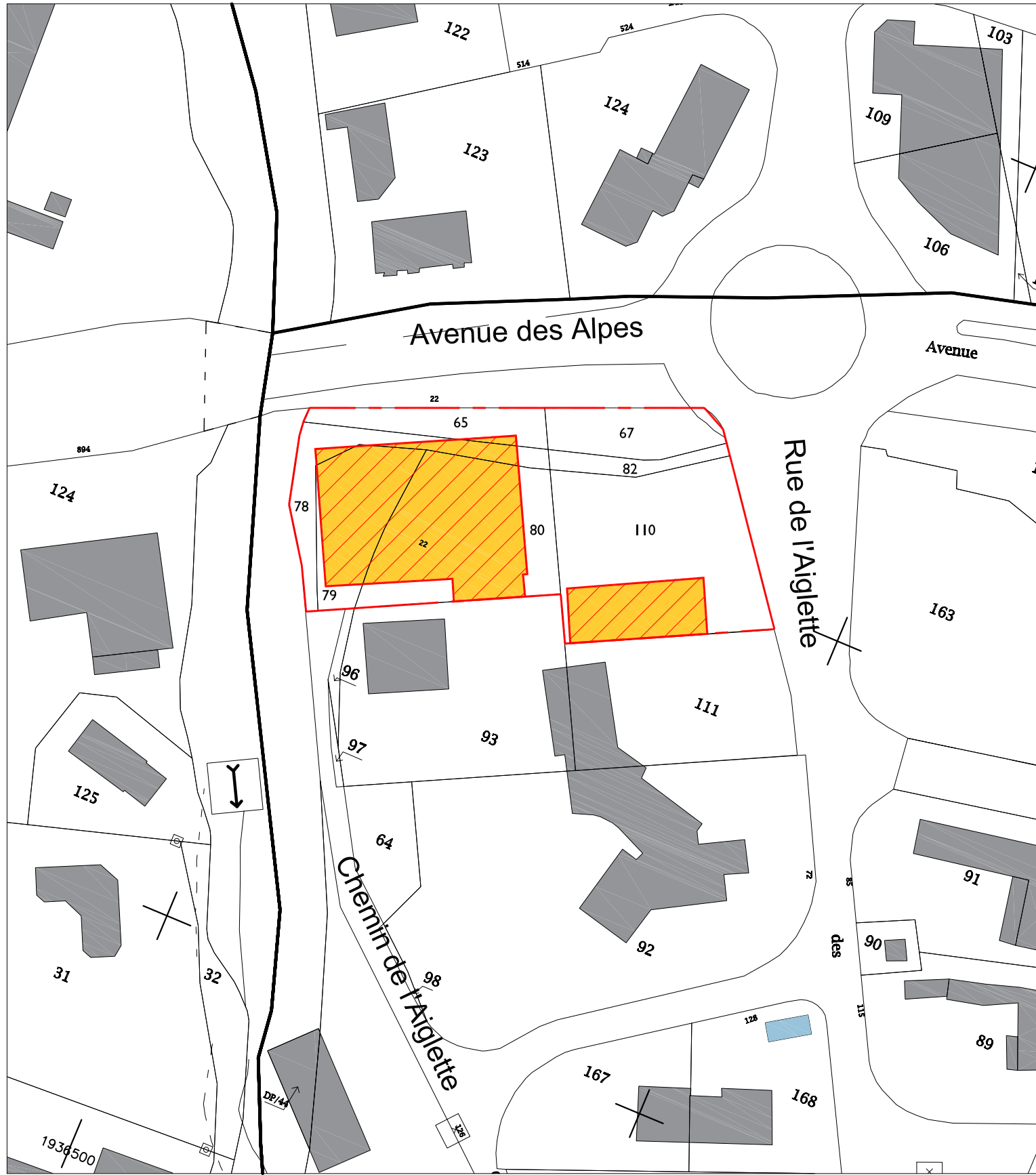
PC1 - Plan de cadastre

Le site longe la Route Départementale 984C / Avenue des Alpes. Actuellement, deux bâtiments commerciaux (First Stop et Leader Price) sont présent sur le site. Ils seront démolis dans le cadre du projet.