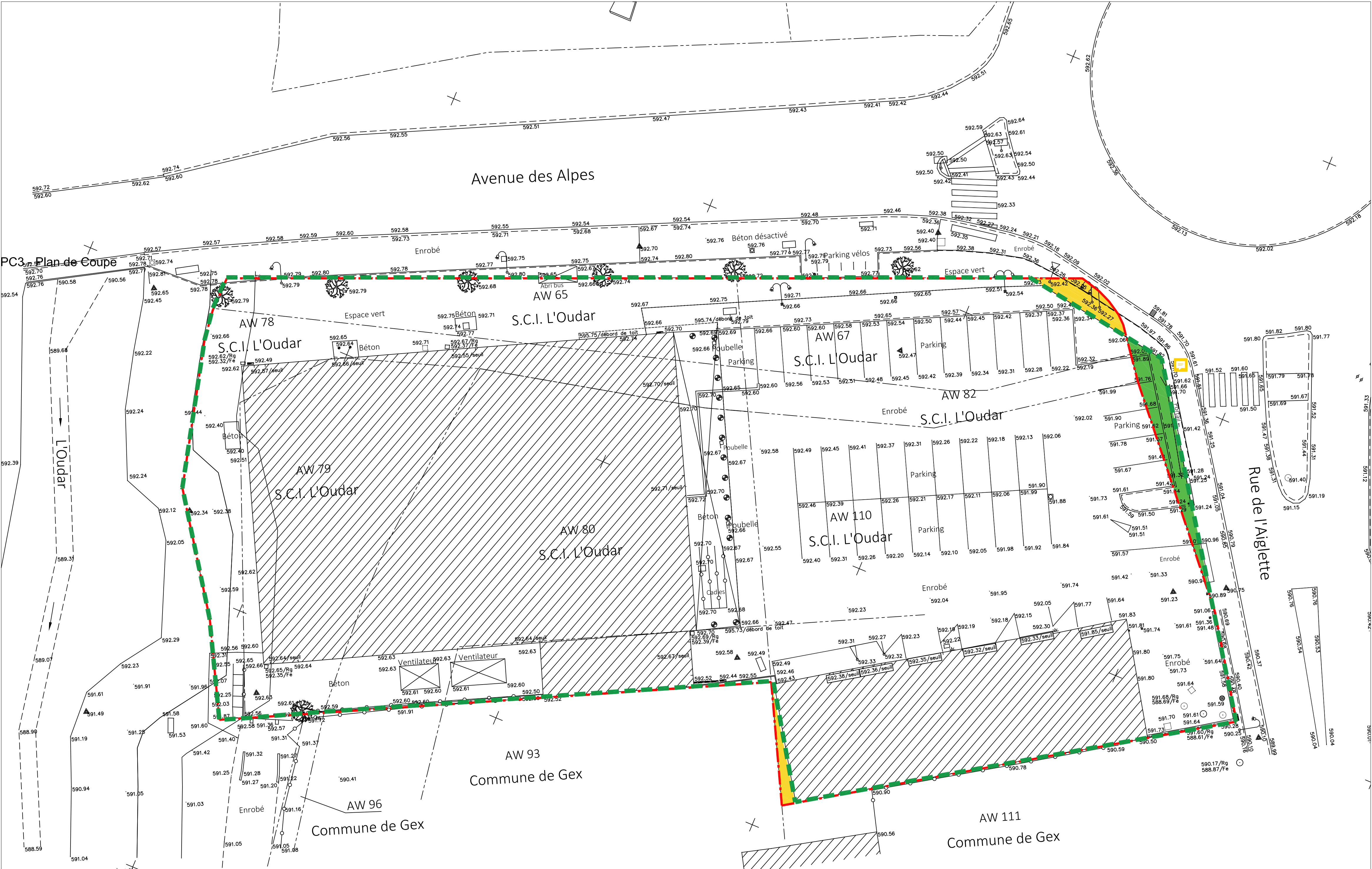
PC3 - Plan de Masse - Plan topographique - Etat des Lieux - Ech : 1/200e