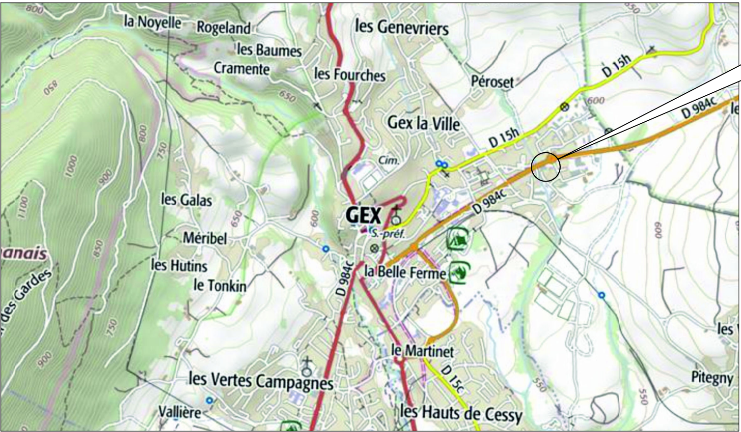
PC1 - Plan de situation