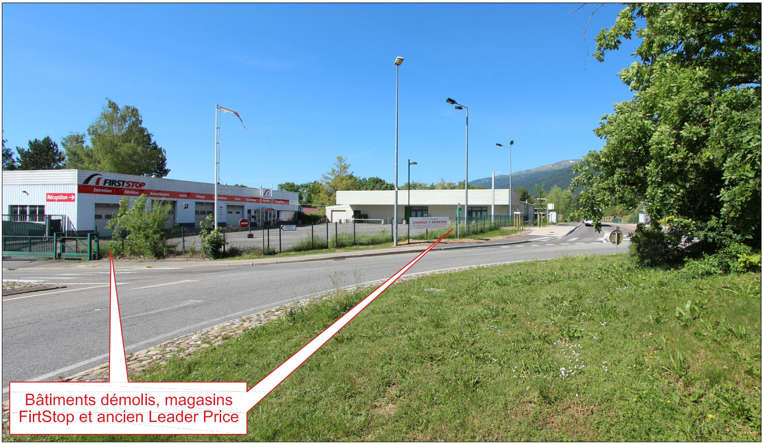
Bâtiments démolis, magasins FirtStop et ancien Leader Price