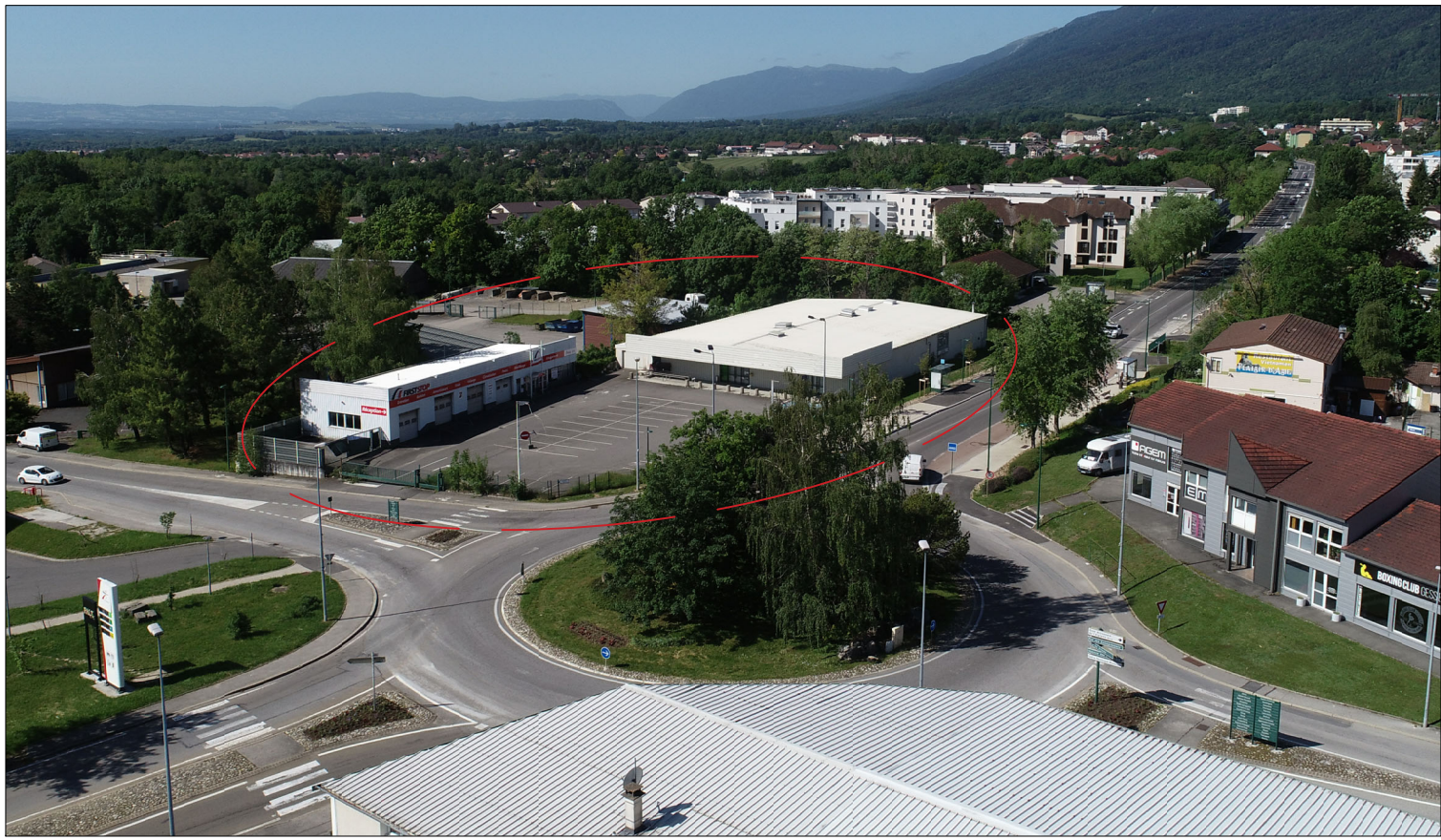
PC8 - Vue lointaine [2]