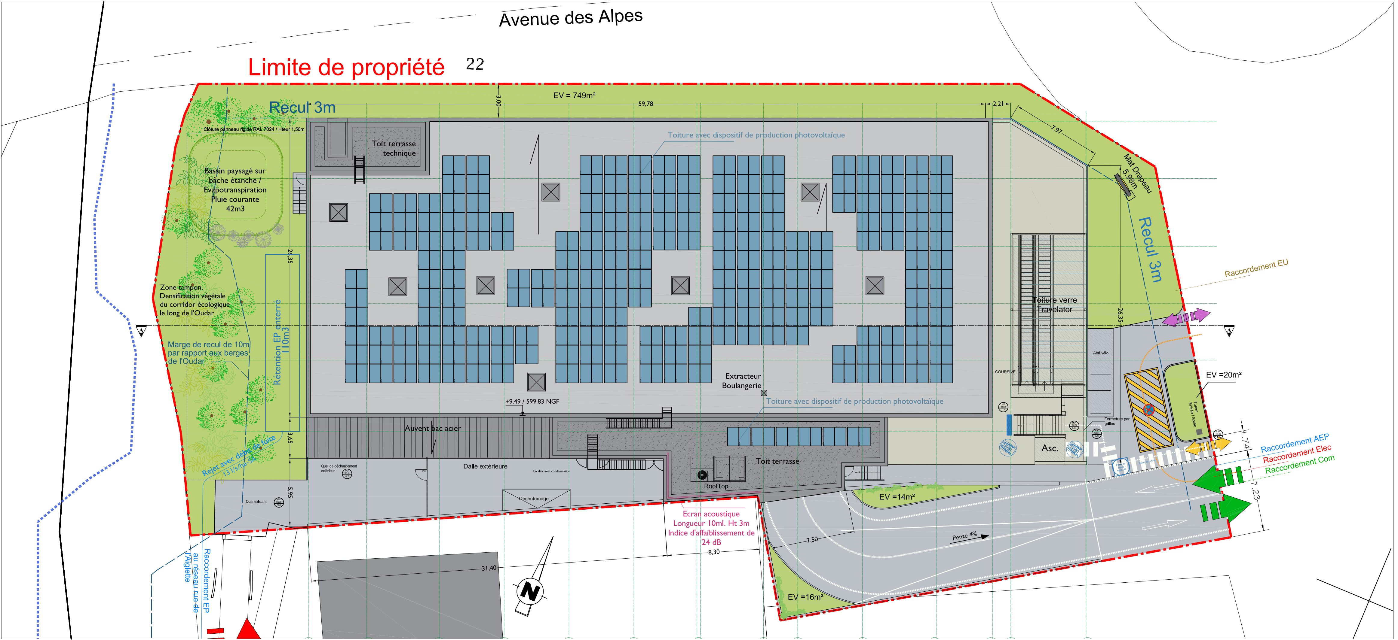
PC2 - Plan de Masse - PC5 - Plan de toiture_Projet - Ech: 1/200e