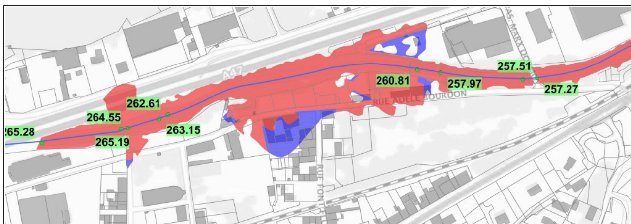
Zonage réglementaire actuel du PPRNPi du Gier sur la commune de Lorette