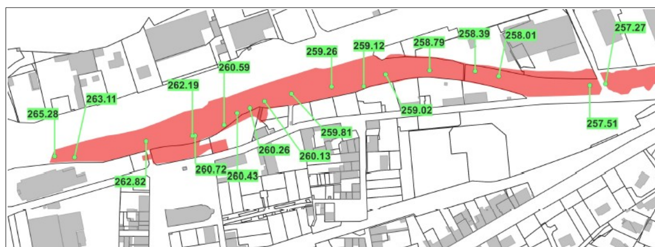
Projet de modification du zonage réglementaire du PPRNPi du Gier sur la commune de Lorette

Le projet de modification du zonage réglementaire du PPRNPi du Gier sort de la zone inondable une quinzaine de parcelles précédemment situées en zone rouge et bleu du PPRNPi du Gier. Une parcelle, précédemment hors zone inondable dans le PPRNPi du Gier, est située en zone rouge sur le projet de modification. Cette parcelle est actuellement occupée par un espace vert.