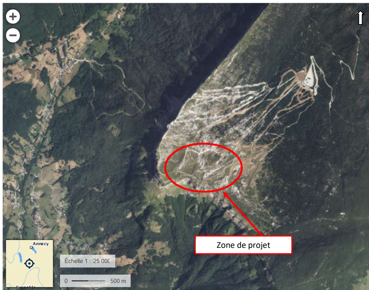
Localisation de la zone de projet – Orthophoto