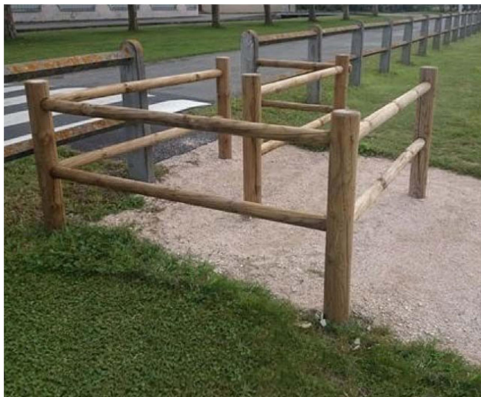
Chicane poteau avec lice bois pour sécuriser accès cheminement piétons