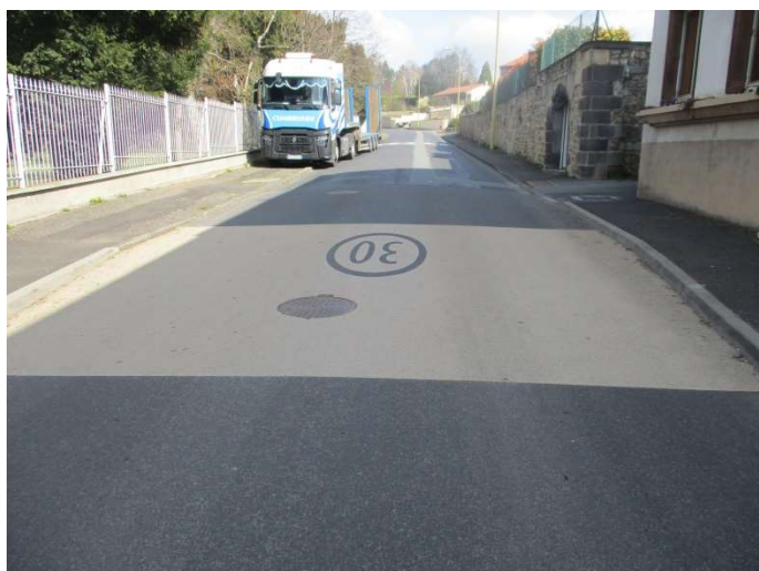
Résine sur chaussée avec logo 30