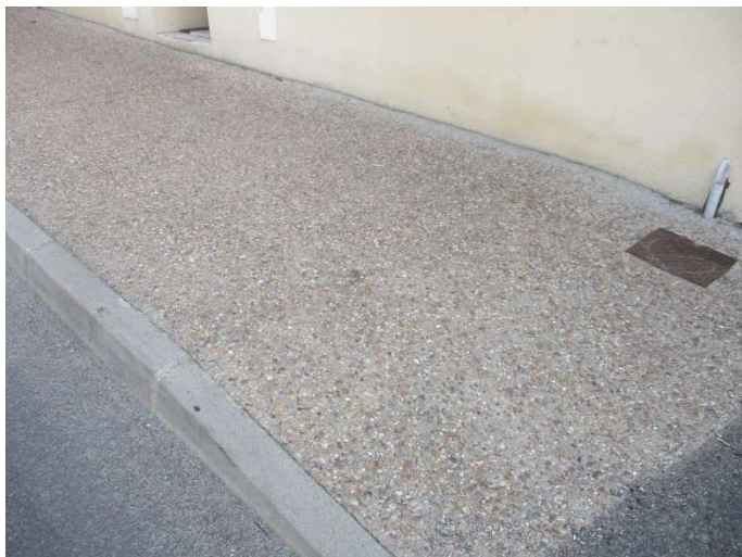
Trottoir en béton désactivé teinte ocre