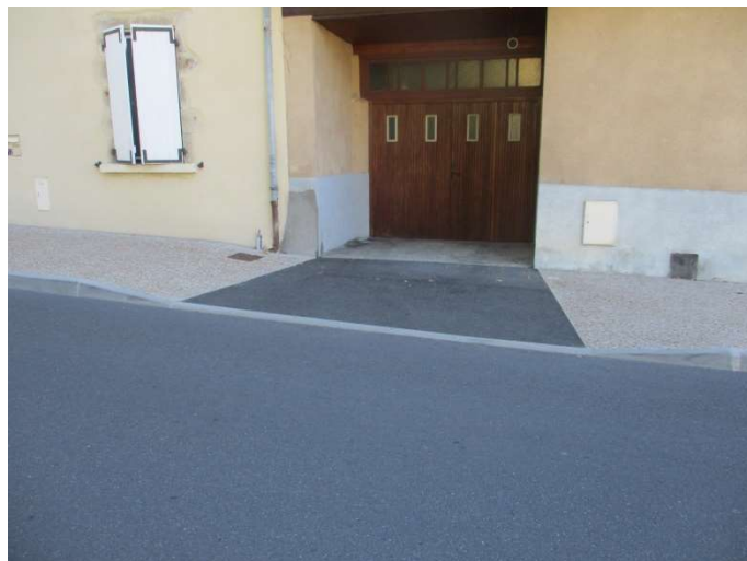
Accès riverain en enrobé