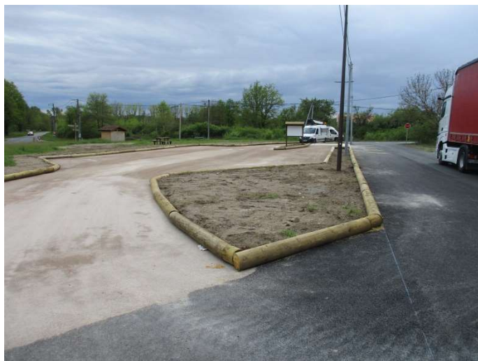
Rondins bois pour délimitation parking ( espace co-voiturage )