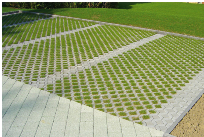
Dalle evergreen sur stationnements