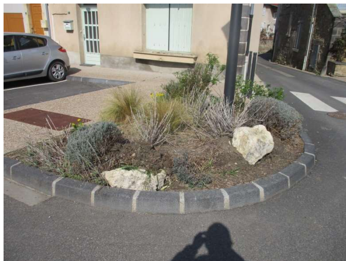
Espace paysager avec bordure type T2