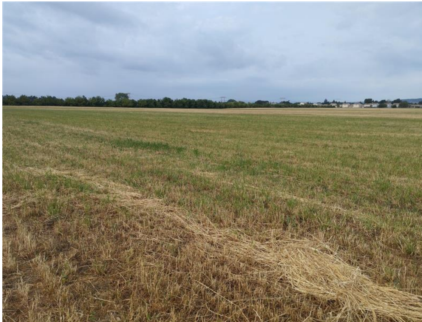
Photographie numéro 2 prise au Nord-Est / Portillon de la zone d'implantation