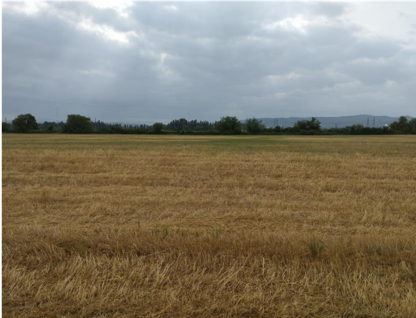
Photographie numéro 3 prise au Ouest de la zone d'implantation