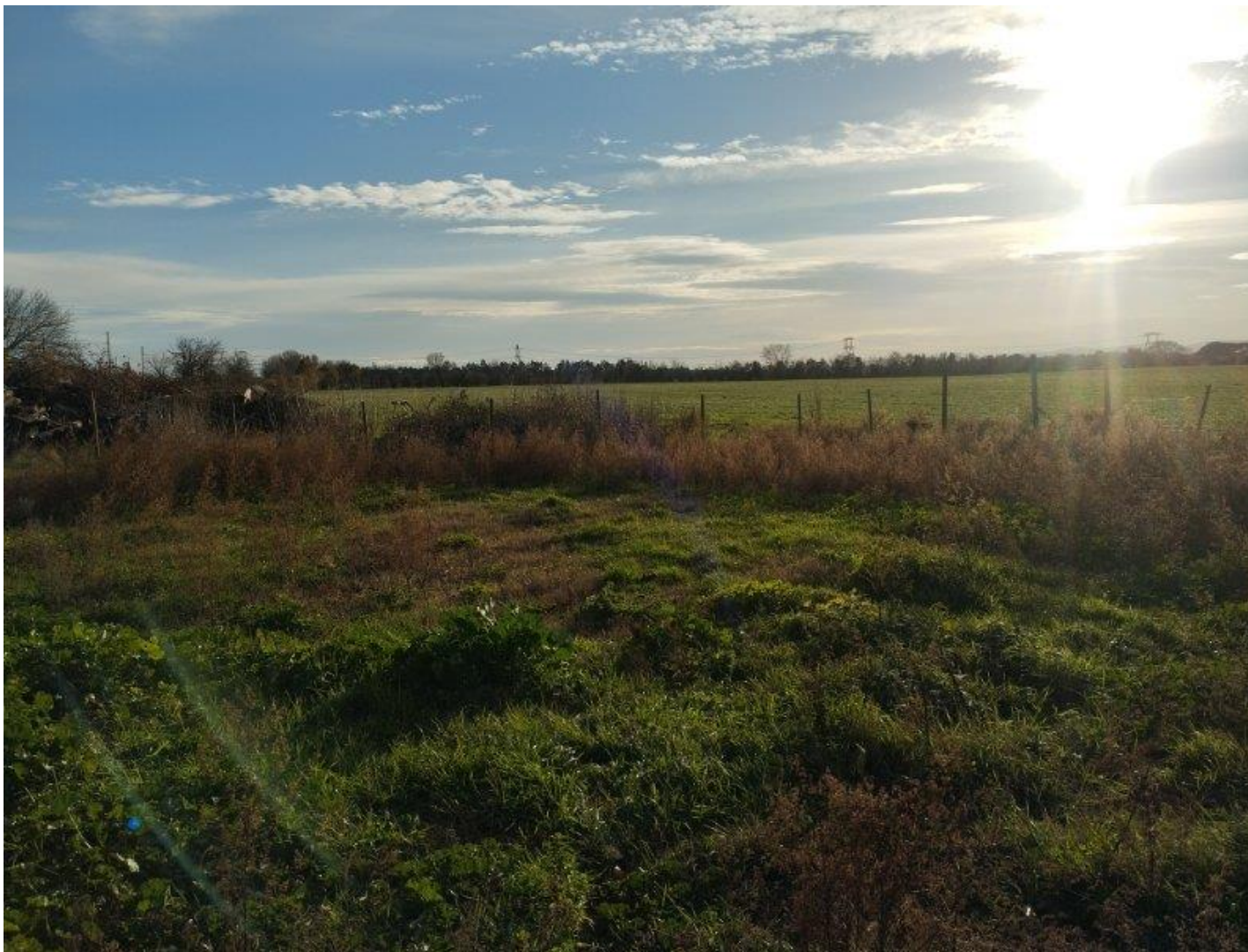
Photographie numéro 6 : Vue lointaine depuis le sentier au Nord