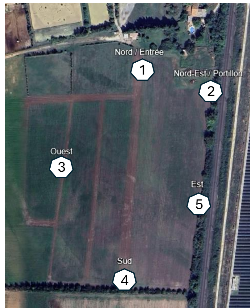
Figure 1 : Localisation des photographies par rapport au projet photovoltaïque