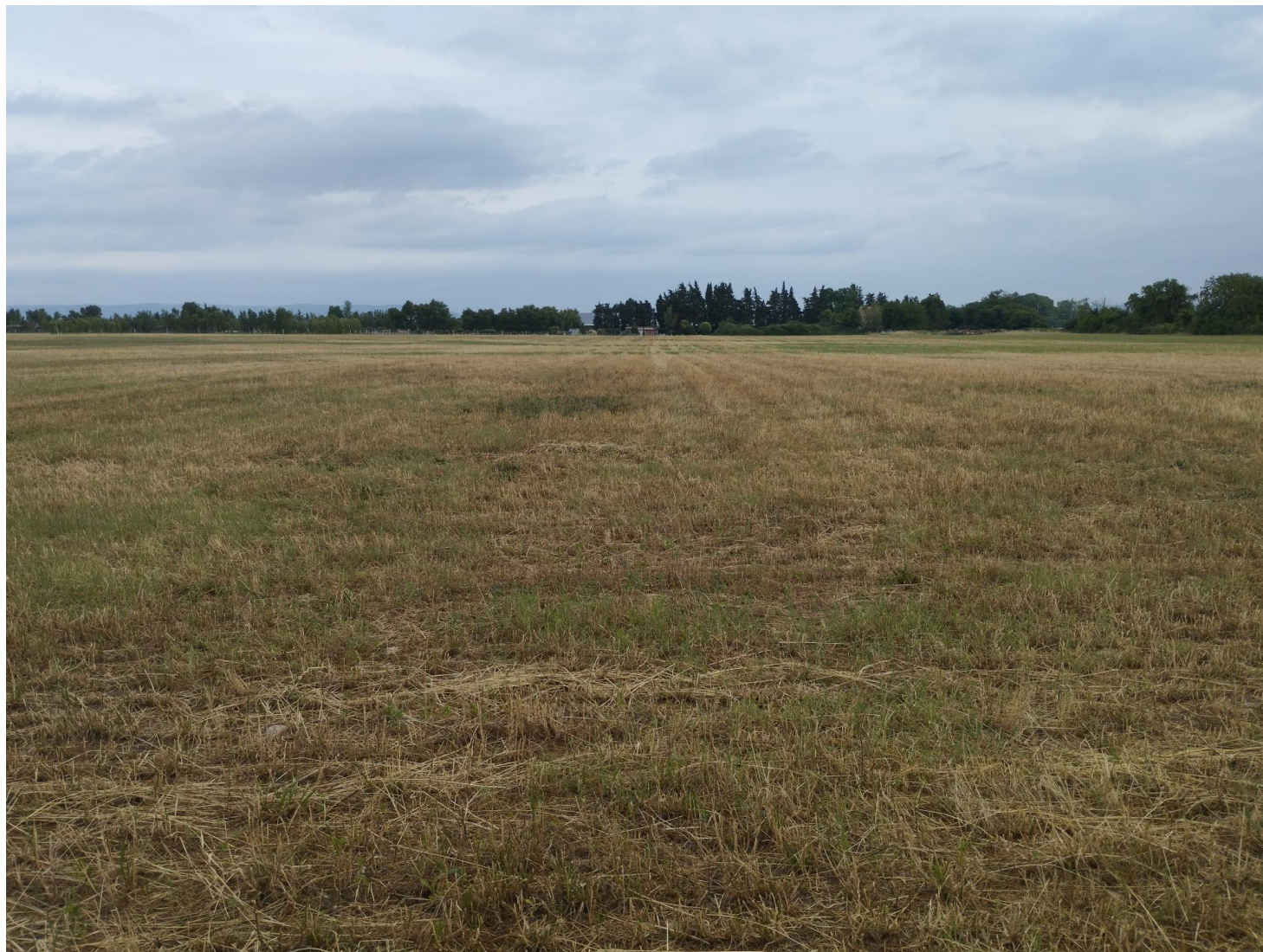
Photographie numéro 4 prise au Sud de la zone d'implantation