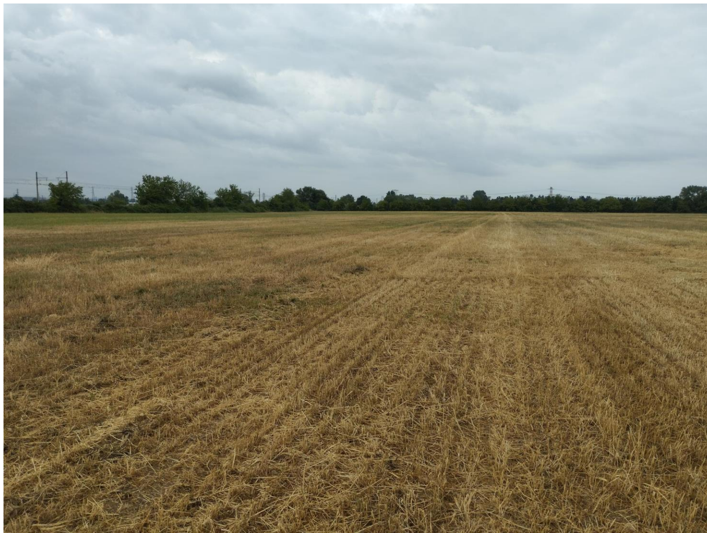
Photographie numéro 1 prise au Nord / Entrée de la zone d'implantation