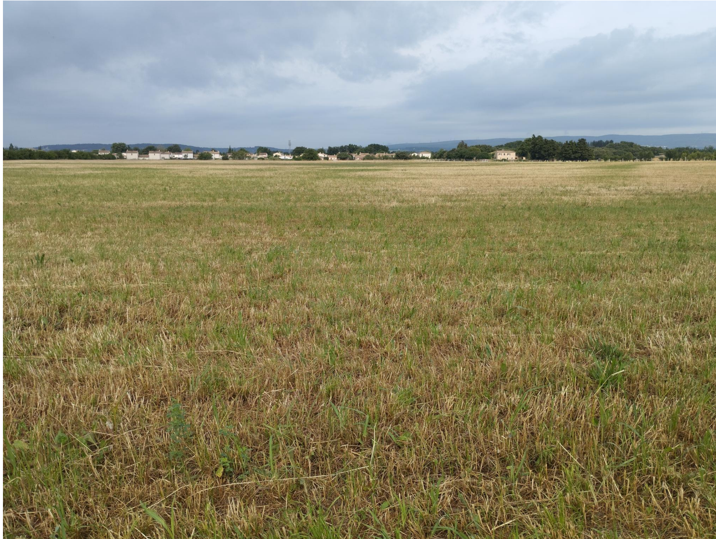
Photographie numéro 5 prise au Est de la zone d'implantation