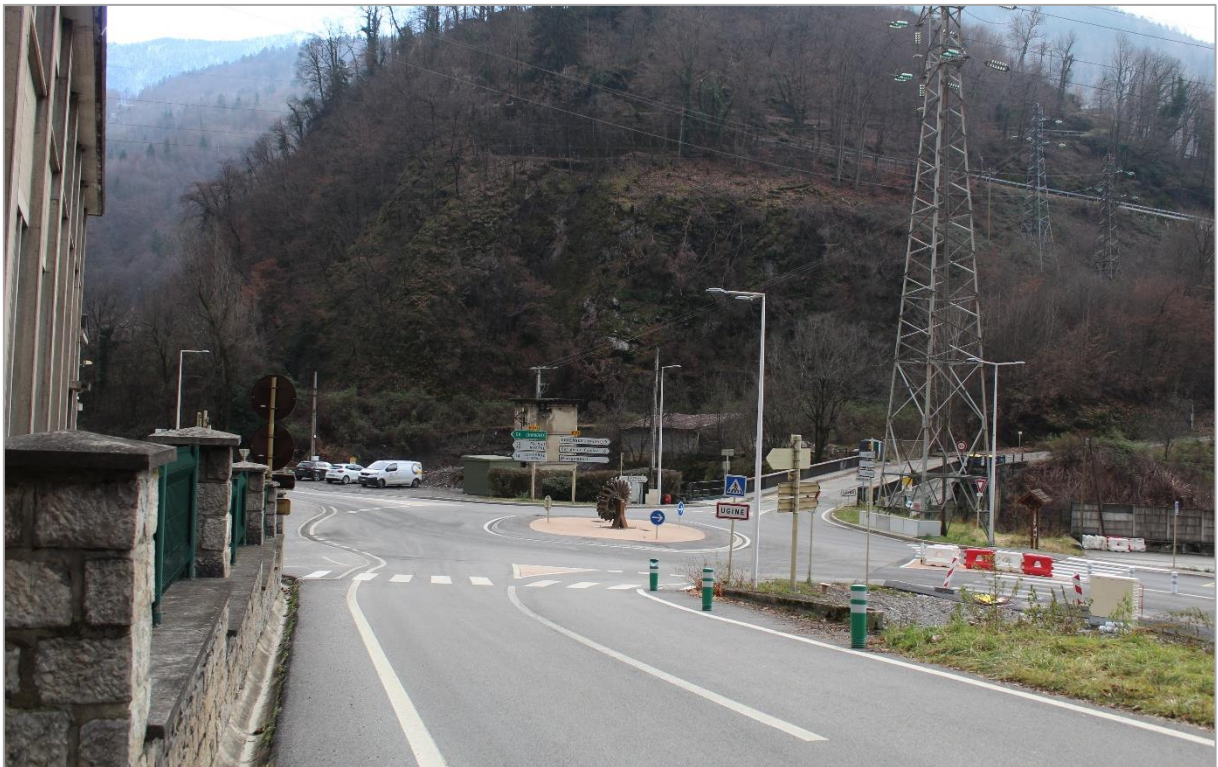
Photographie n°4 : Vue sur la route D71