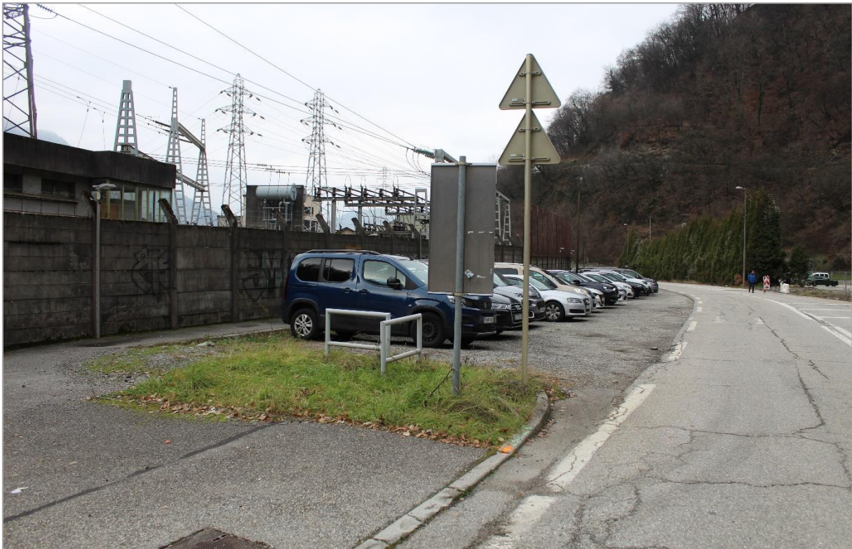
Photographie n°1 : Vue de la route D1212