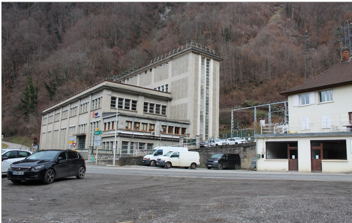
Photographie n°5 : Vue sur la centrale hydroélectrique EDF d'Arly