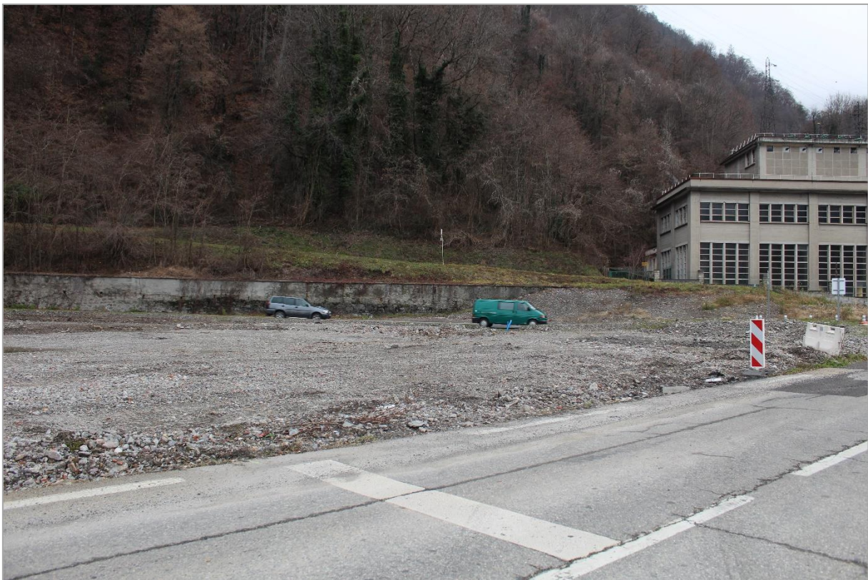
Photographie n°2 : Vue sur l'emplacement du futur poste depuis le sud