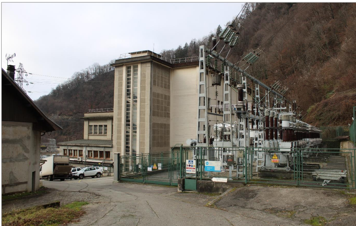
Photographie n°6 : Vue sur le poste existant d'Arly