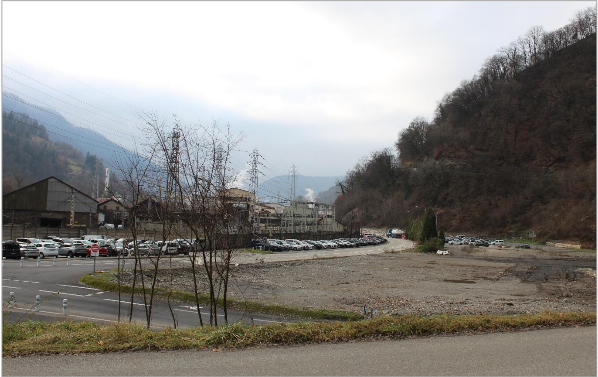
Photographie n°3 : Vue de l'emplacement du futur poste depuis le nord