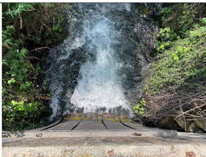
Figure 7 : canal de fuite