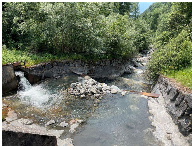
Figure 4 : aval prise d'eau