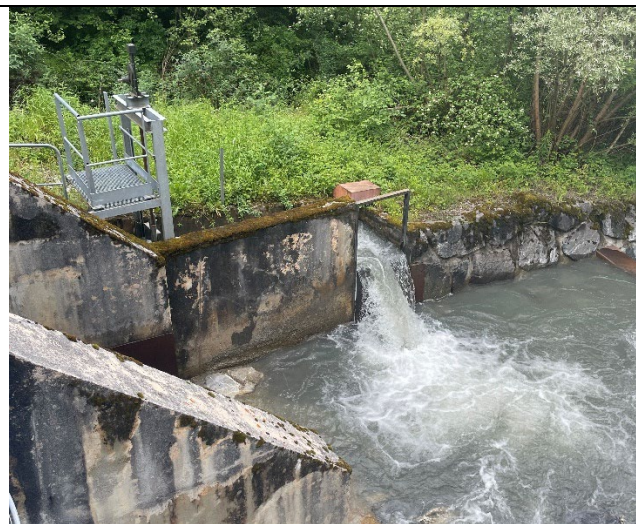
Figure 2 : sortie de la dévalaison