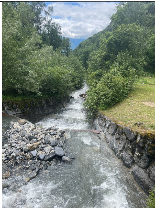
Figure 6 : vue de l'aval de la prise d'eau