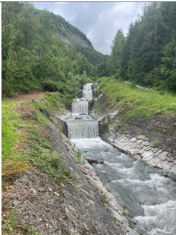
Figure 5 : seuils RTM dans le TCC