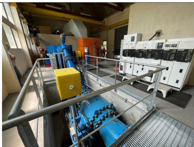
Figure 8 : intérieur de l'usine