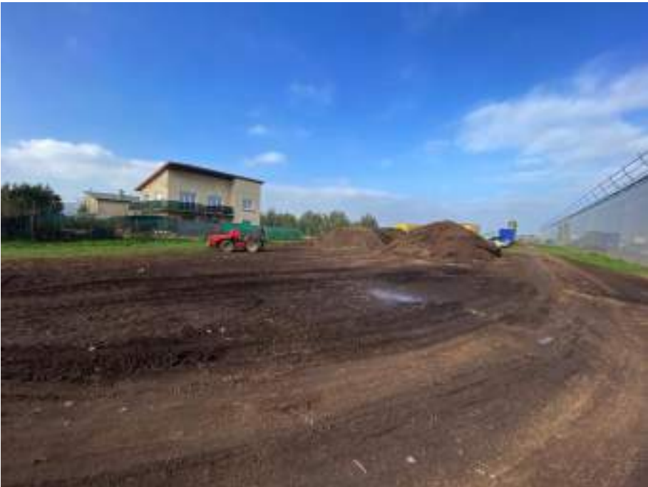
Tas de substrat laissé aux intempéries