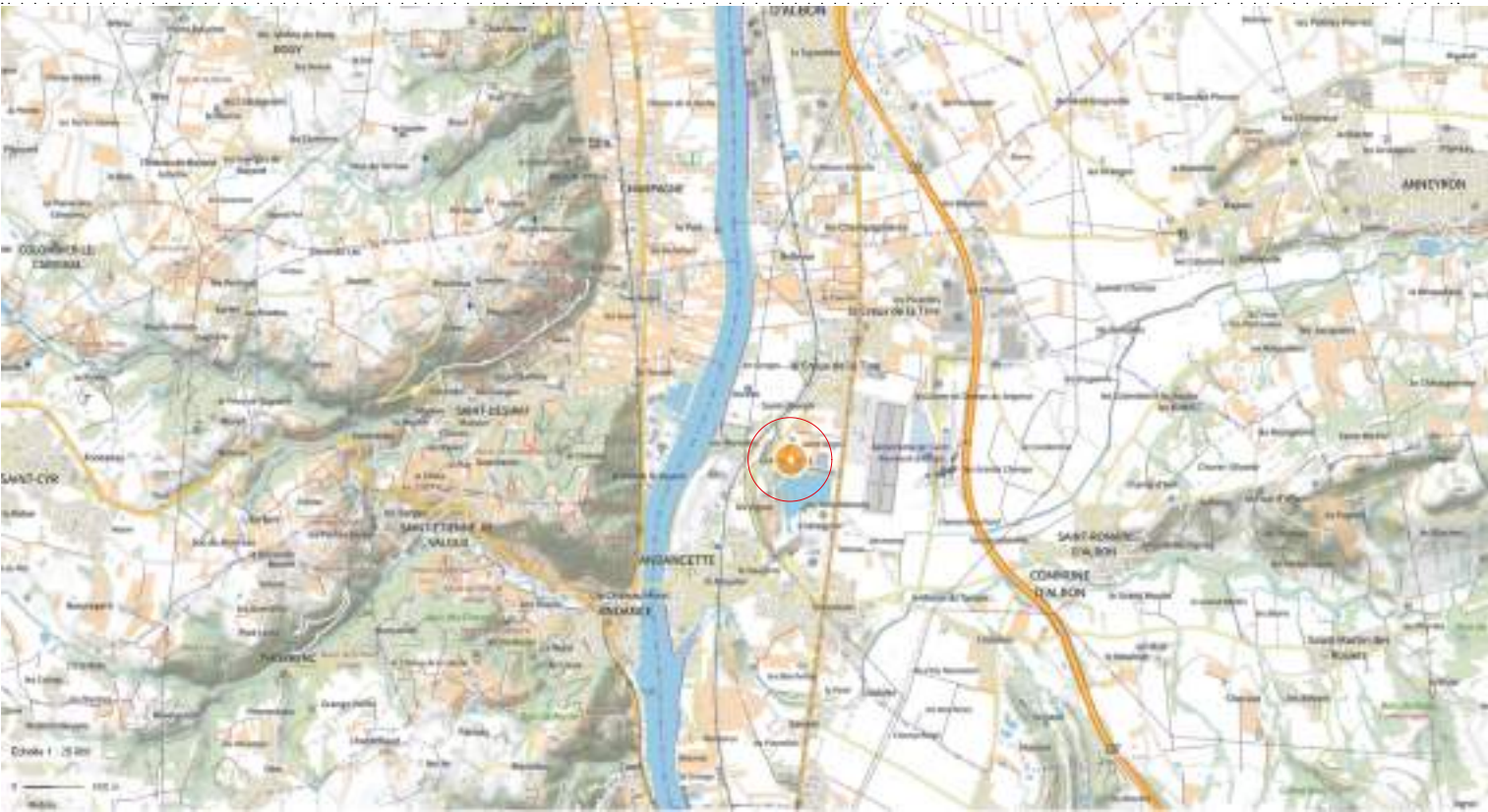
PLAN DE SITUATION 01