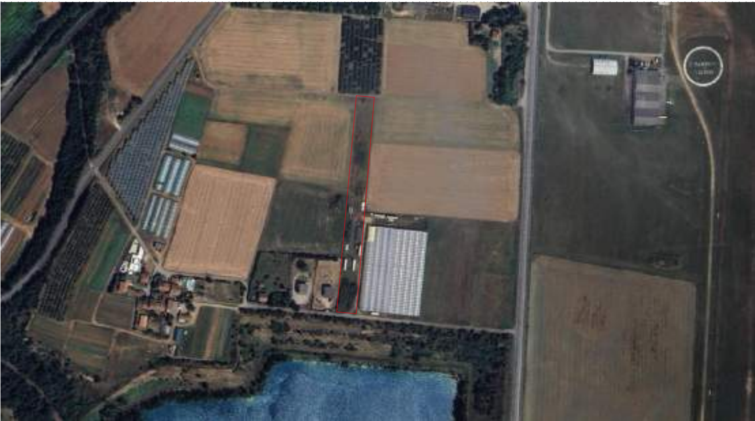
PLAN DE SITUATION 02