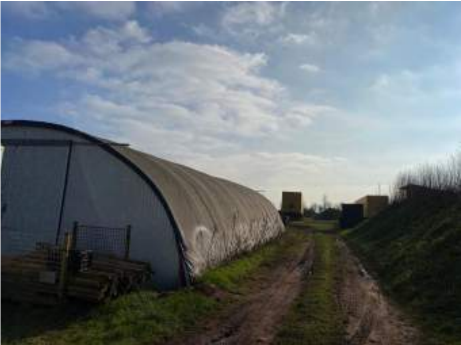
stockage et conteneur à déposer