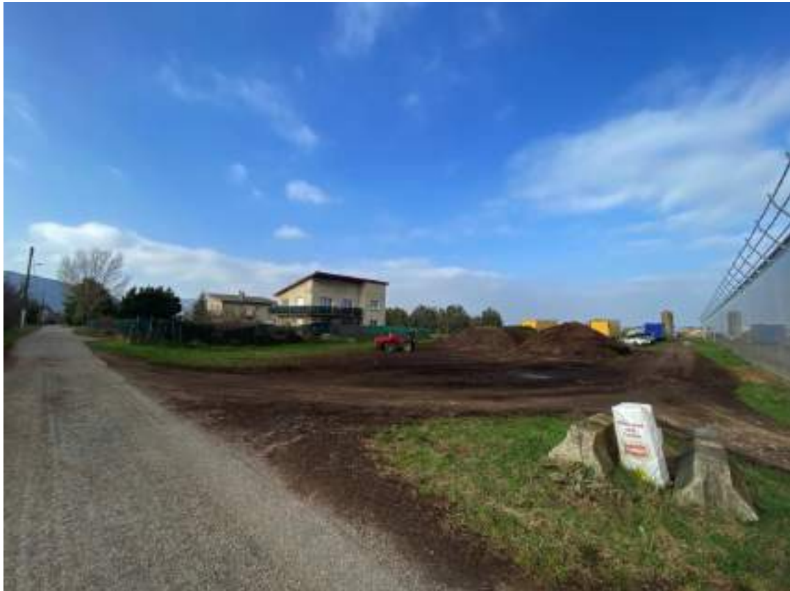
VUE depuis la route