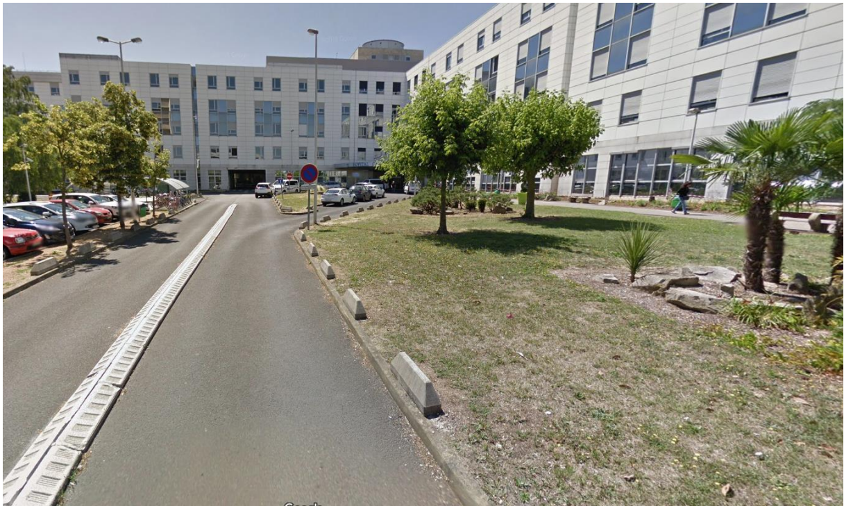
Figure 5 : prise de vue 5