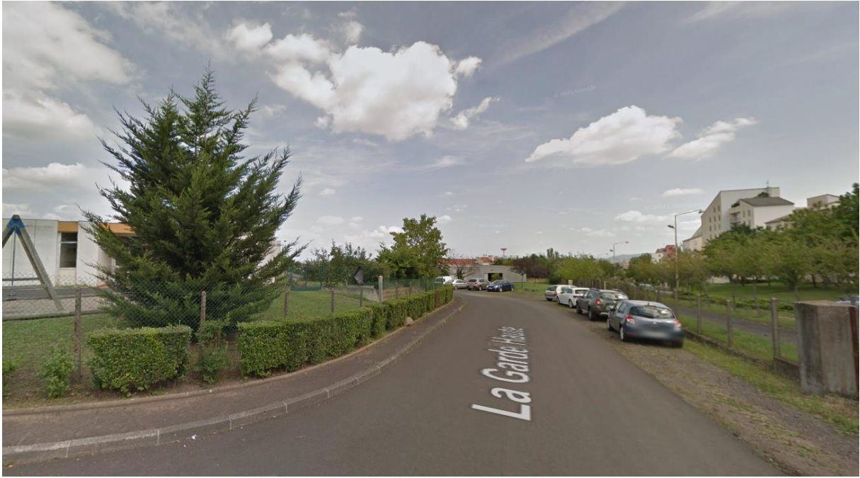
Figure 7 : prise de vue figure 7