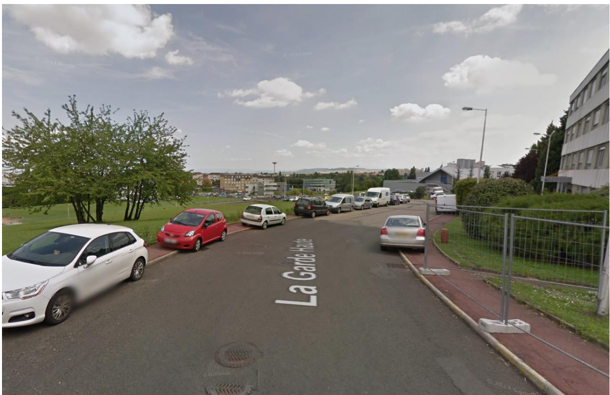
Figure 6 : prise de vue 6