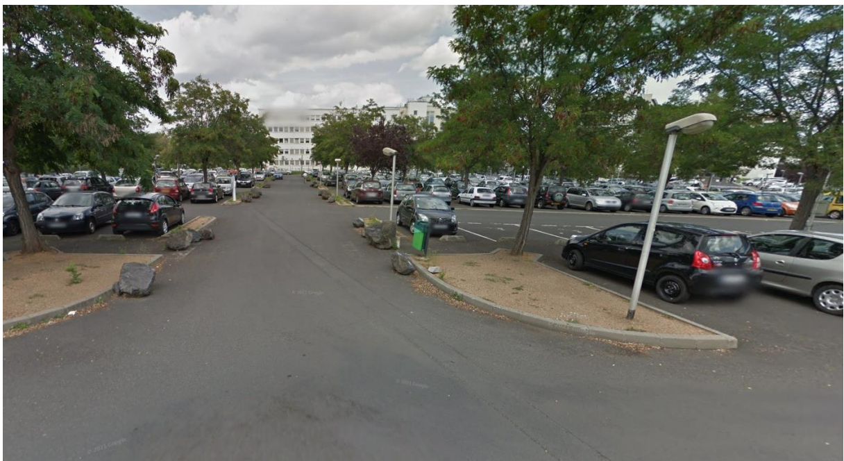
Figure 2 : prise de vue 2