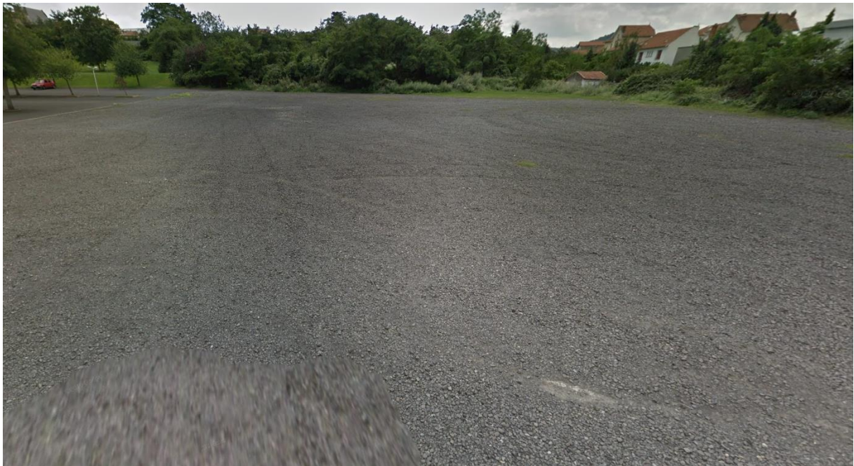
Figure 1 : prise de vue 1