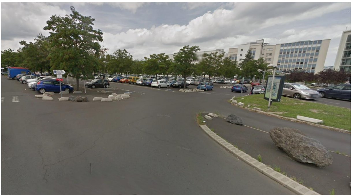
Figure 4 : prise de vue 4