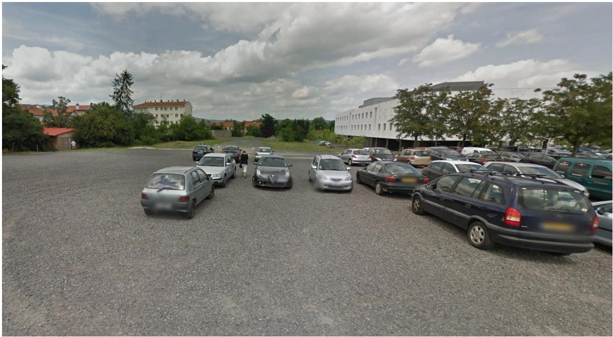
Figure 3: prise de vue 3