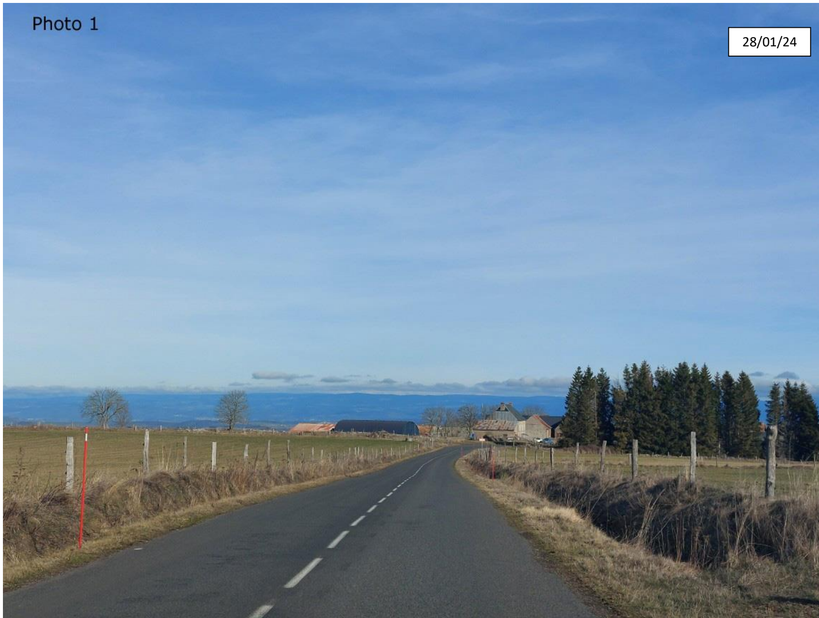
Plan de situation : Photographie de la parcelle côté Ouest (éloignée)