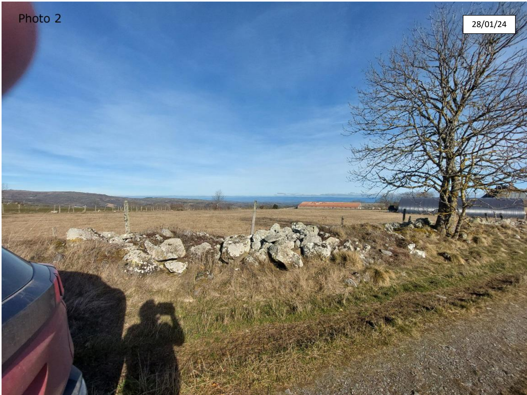
Plan de situation : Photographie de la parcelle côté Ouest (proche)