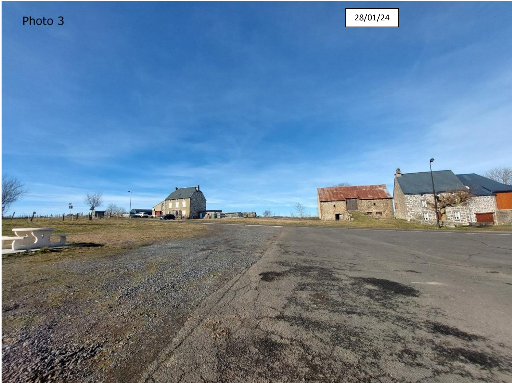
Plan de situation : Photographie de la parcelle côté Nord