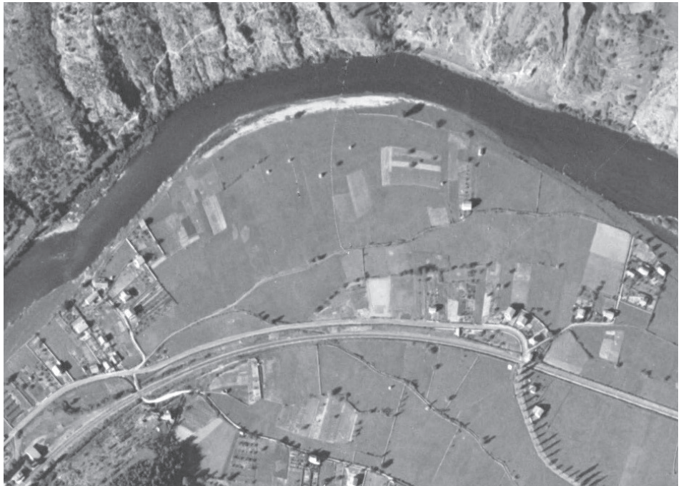
Vue aérienne du site - 1947

Le projet d'extension se positionne au sud-ouest du camping existant. Il propose d'investir l'ancien terrain de football de la commune en travaillant sa connexion fonctionnelle et paysagère en articulation avec les espaces et circulations du camping existant et du site élargi dans une logique de réorganisation de l'accueil.