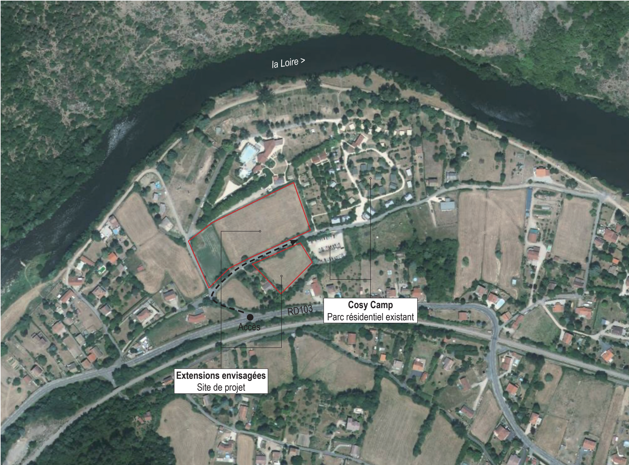
Vue aérienne actuelle du site

Le projet d'extension se positionne au sud-ouest du camping existant. Il propose d'investir l'ancien terrain de football de la commune en travaillant sa connexion fonctionnelle et paysagère en articulation avec les espaces et circulations du camping existant et du site élargi dans une logique de réorganisation de l'accueil.