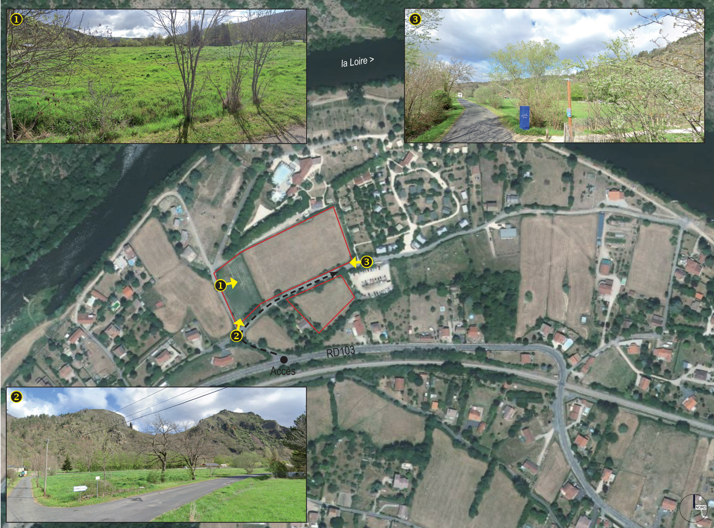
Vue aérienne actuelle du site

Le projet d'extension du camping existant du Cosy Camp s'inscrit dans l'ensemble de paysages, emblématique de la Haute-Loire, de la vallée et des gorges de la Loire.