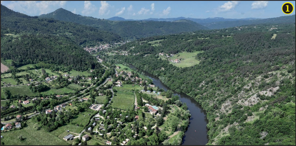
Prise de vue aérienne à proximité du château d'Artias