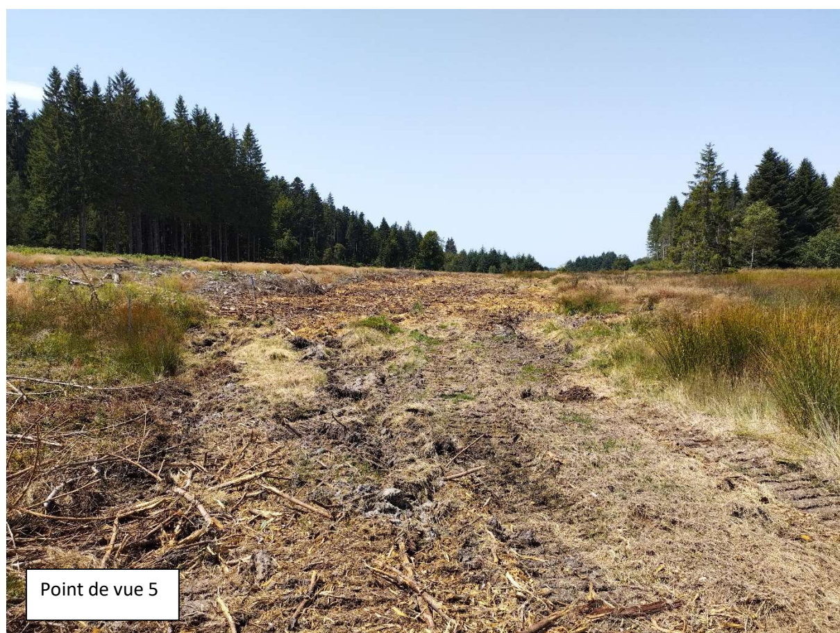
Point de vue 5

Situation du projet dans le paysage proche après réalisation de l'ensemble des travaux de restauration, photo prise le 31 juillet 2024