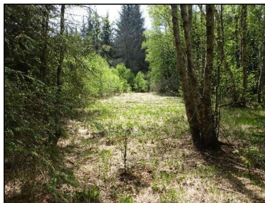
Milieu en cours de fermeture