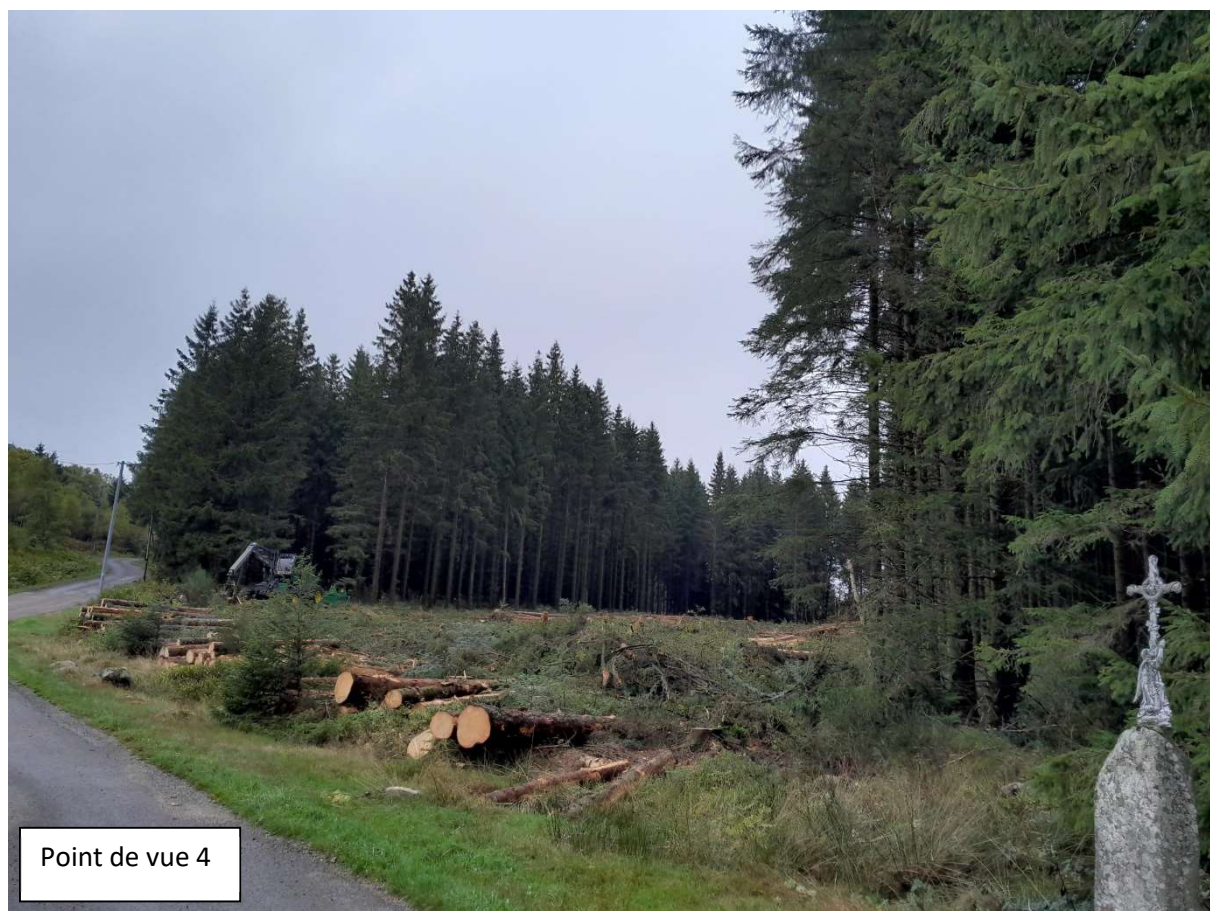
Point de vue 4

Situation du projet dans le paysage proche durant les travaux d'abattage photo prise le 27 septembre 2022