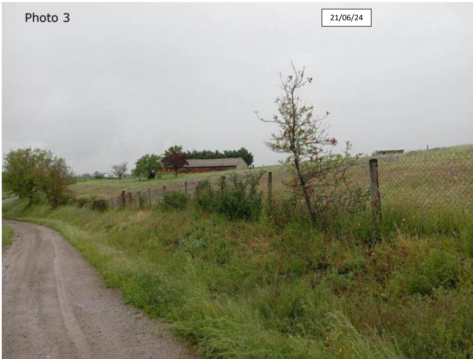
Plan de situation : Photographie de la parcelle côté Sud Est