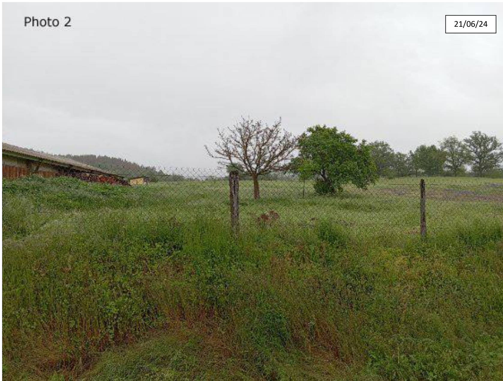
Plan de situation : Photographie de la parcelle côté Sud Ouest