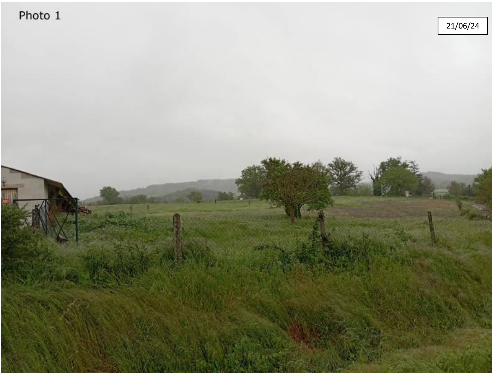
Plan de situation : Photographie de la parcelle côté Sud Ouest