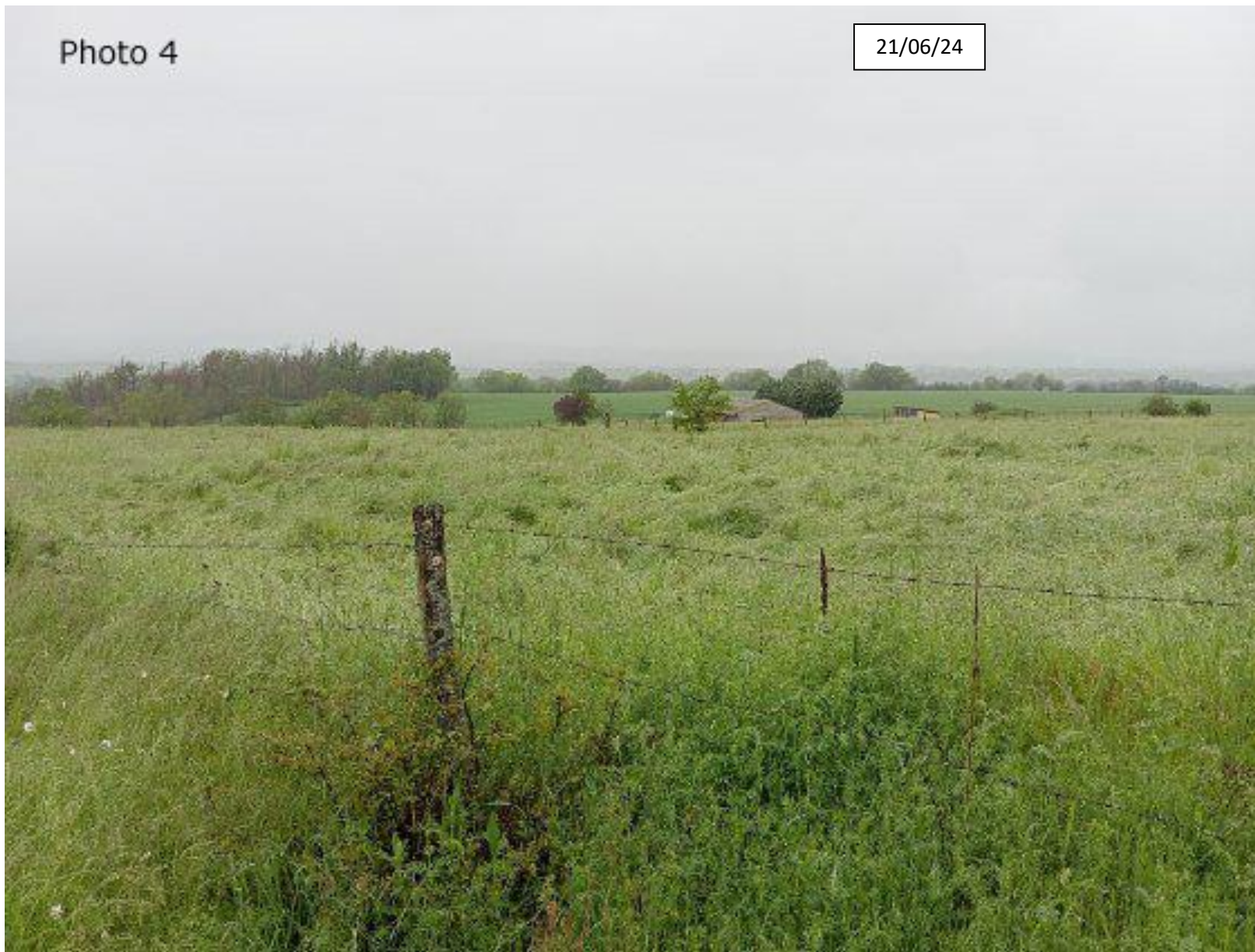
Plan de situation : Photographie de la parcelle côté Est