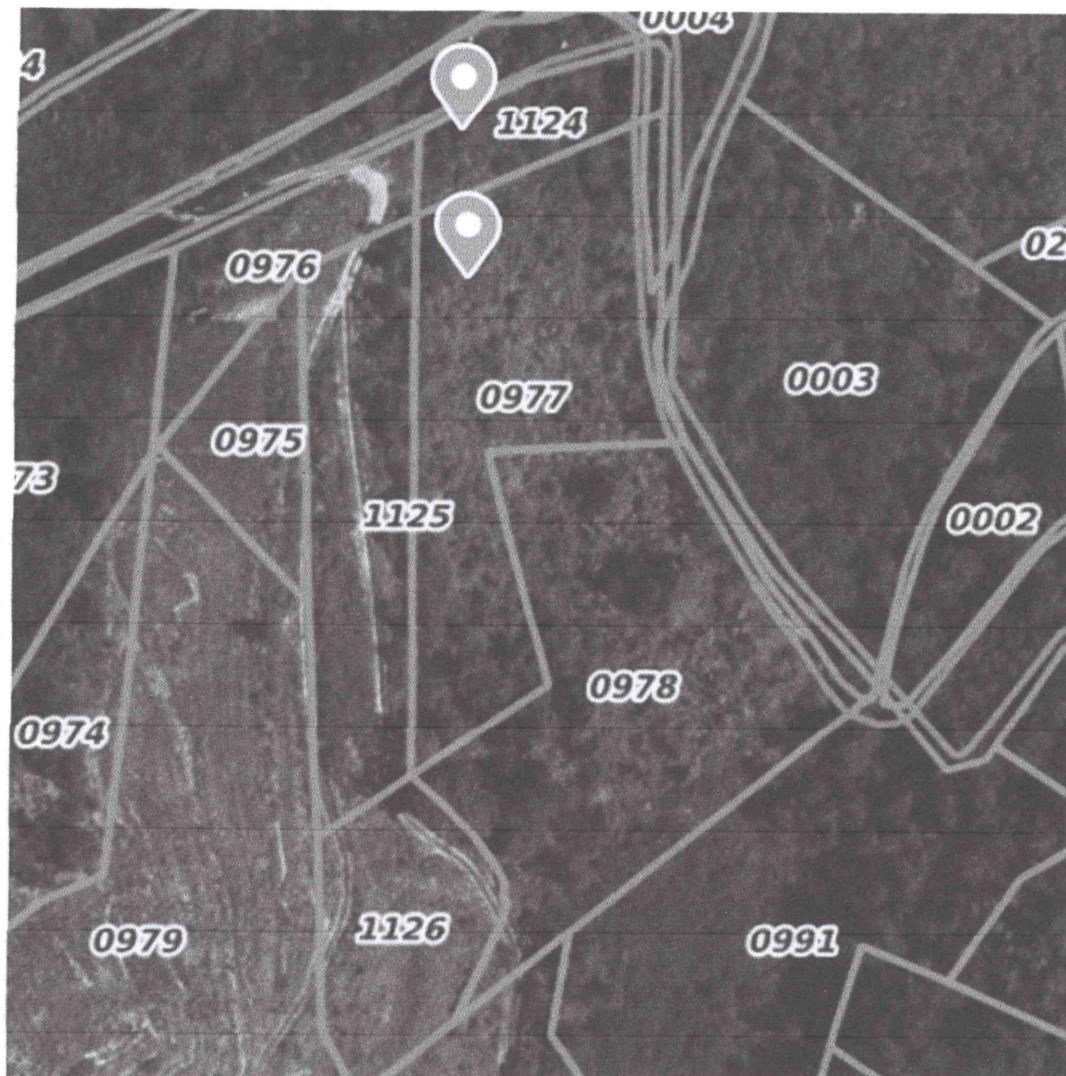
Vue par rapport Ile de la platière