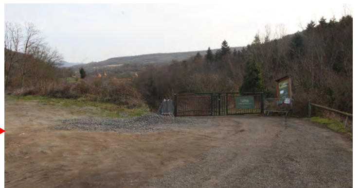
Plan de masse - Etat des lieux - Repérage