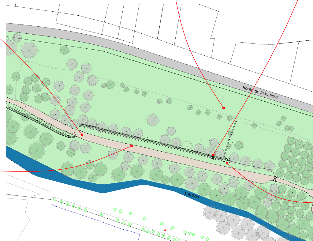
MAITRE D'ŒUVRE MAITRE D'OUVRAGE Ce plan ne peut pas servir à l'exécution des travaux A.C.A. Architectes & Associés Architecture Conservation et Aménagement 41 avenue Albert Elisabeth 63000 Clermont-Ferrand Téléphone: 04 73 98 50 98 - Télécopie: 04 73 98 54 44 aca@aca-architectes.com SAS EMERAUDE Biopôle Clermont Limagne 63360 SAINT-BEAUZIRE CHATEAU DE LA BATISSE - M.H. ALLEE D'ENTREE ET AMENAGEMENTS DE STATIONNEMENTS ech. 1/1500 EXAMEN AU CAS PAR CAS PREALABLE A LA DDE D'EVALUATION ENVIRONNEMENTALE PHASE DOSSIER INDICE TITRE DATE PLANCHE EMETTEUR Photographies du site PA 1 1 INITIAL 30/05/2024 359 AD