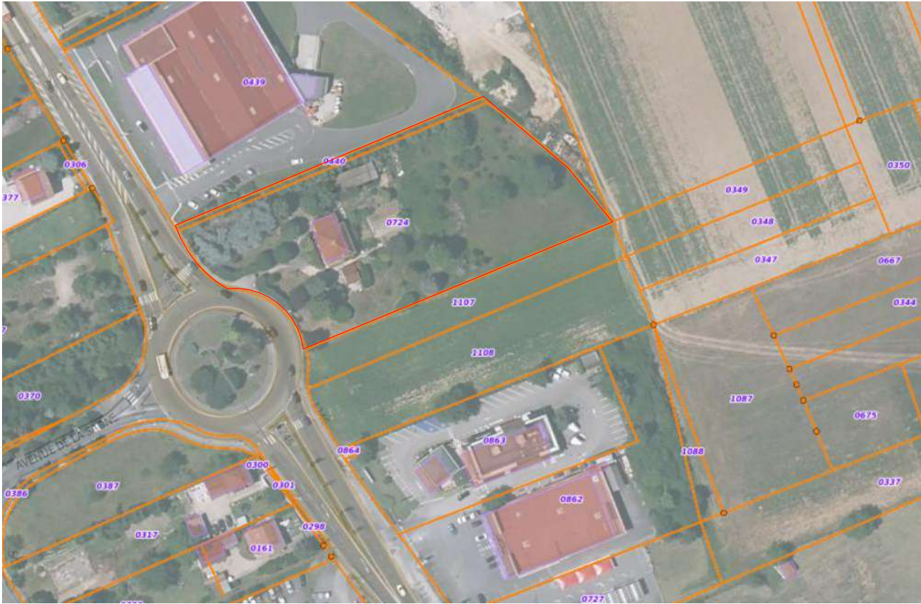
Parcelles cadastrales : AO724-A0440