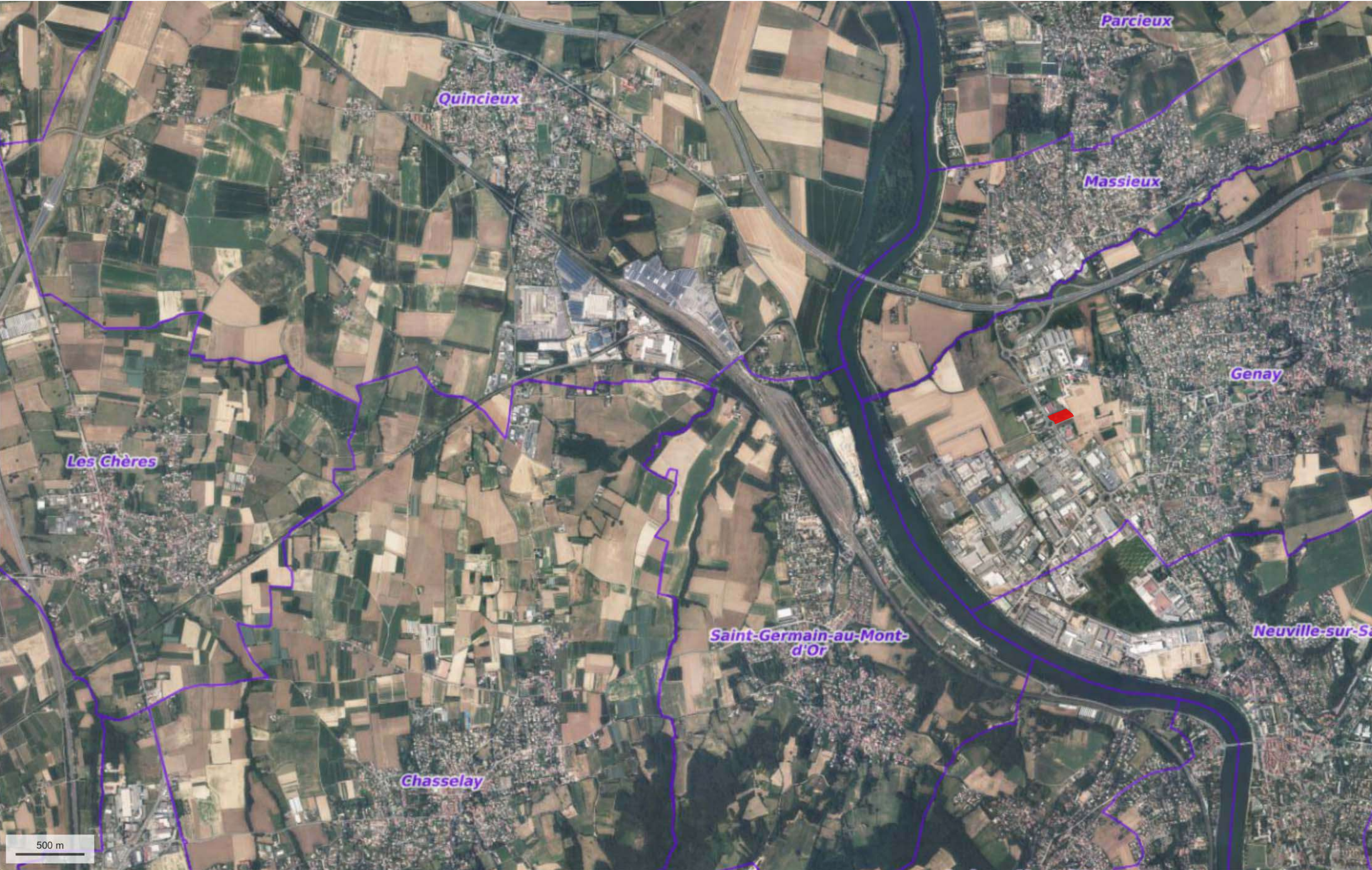
Plan Situation 1/25 000