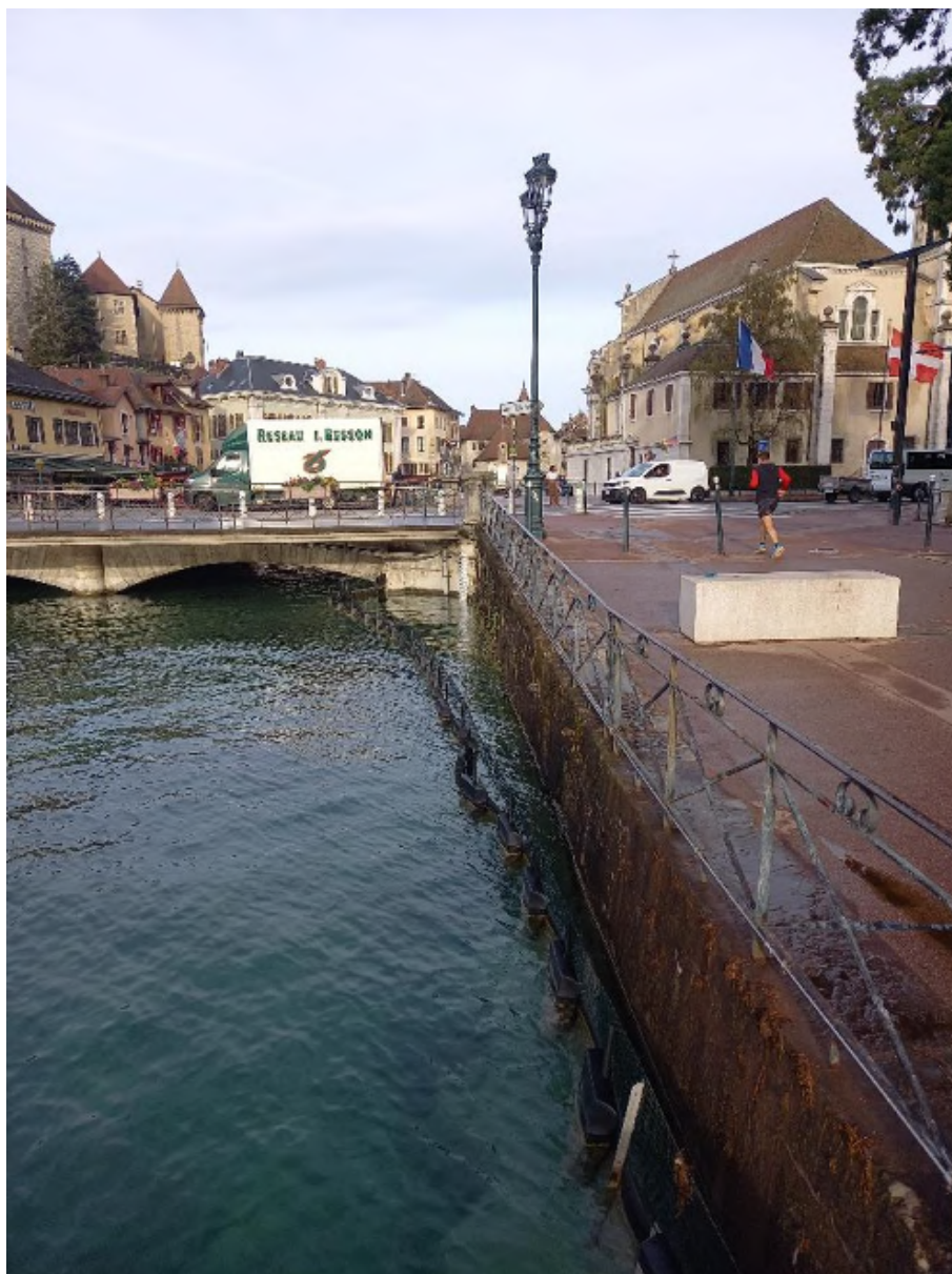
6 – Vue de l'extrémité du Quai Napoléon du Canal du Thiou au niveau du point de rejet envisagé (vue vers l'Ouest)