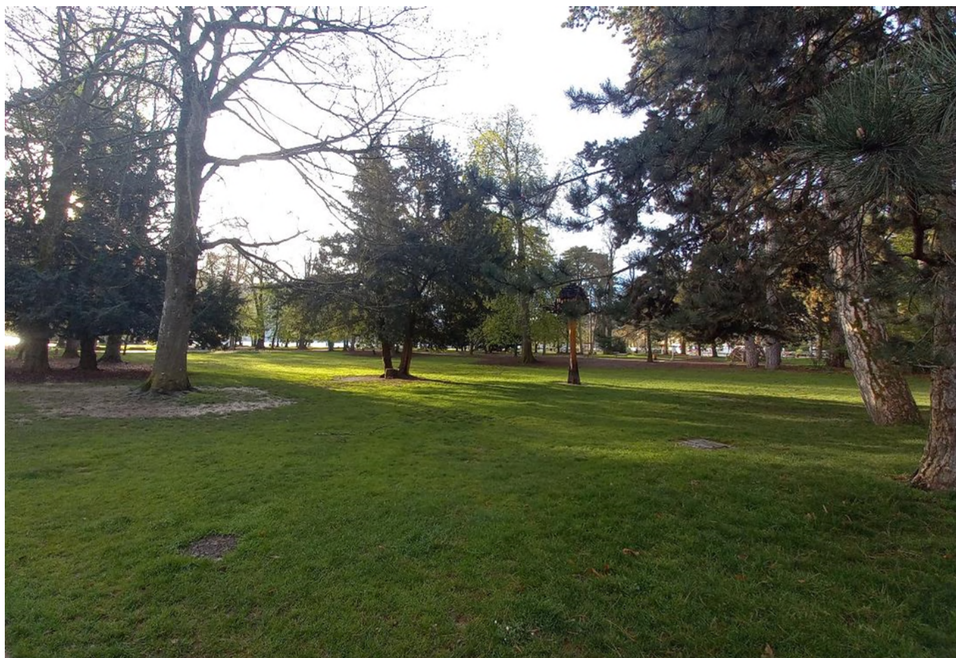
2 – Vue d'une zone potentielle d'implantation de forage de captage en nappe (vue vers le Sud)