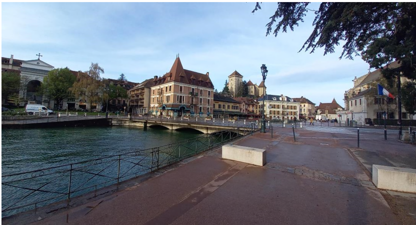
5 – Vue de l'extrémité du Quai Napoléon du Canal du Thiou (vue vers l'Ouest/Sud-Ouest)