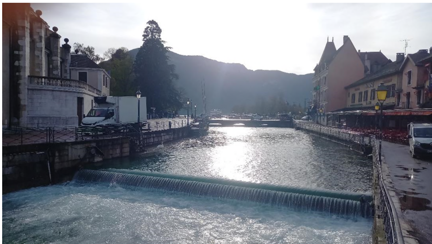
9 – Vue du Canal du Thiou et du seuil en amont du Pont Perrière (vue vers l'Est, Pont de la Halle en arrière-plan)