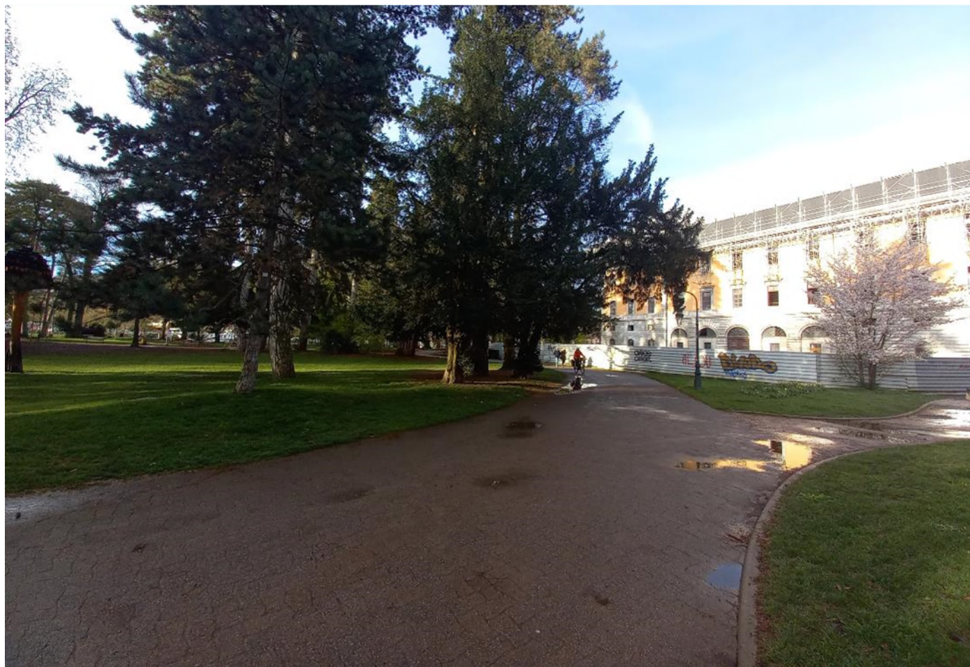
1 – Vue de l'Hôtel de Ville depuis les Jardins de l'Europe (vue vers le Sud-Ouest)