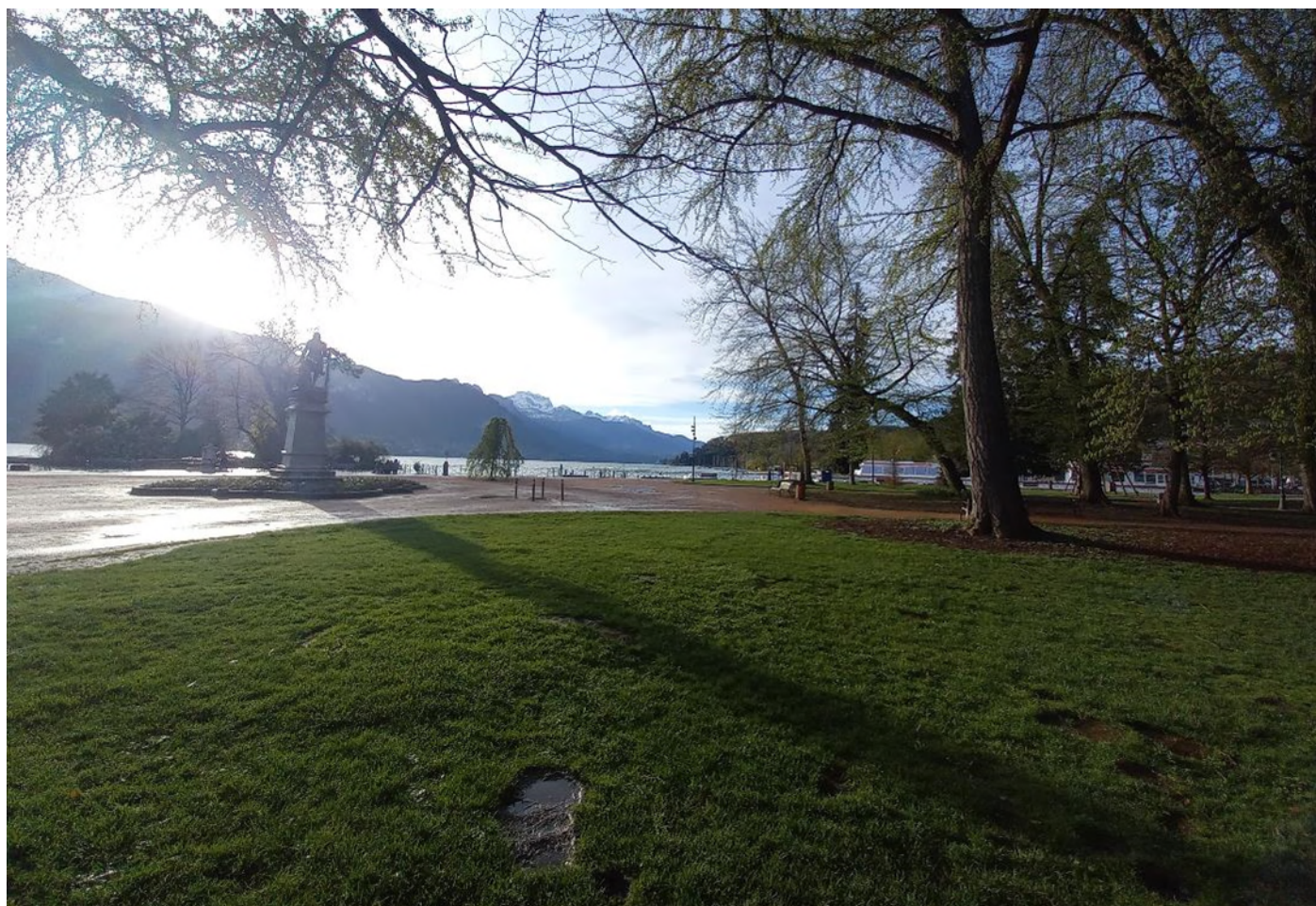
3 – Vue d’une zone potentielle d’implantation de forage de captage en nappe (vue vers le Sud-Est)