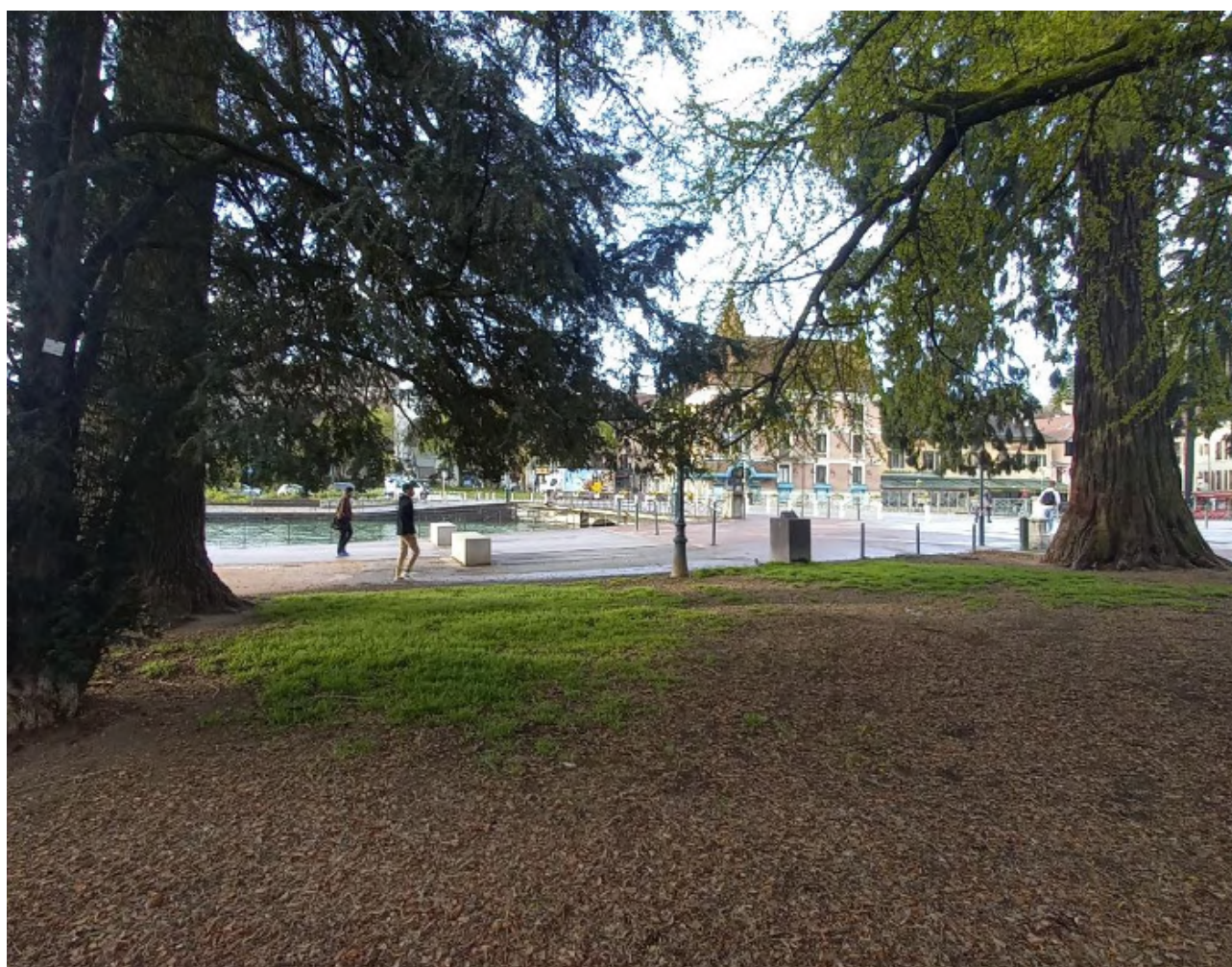
4 – Vue depuis les Jardins de l’Europe vers le Quai Napoléon du Canal du Thiou (vue vers le Sud)