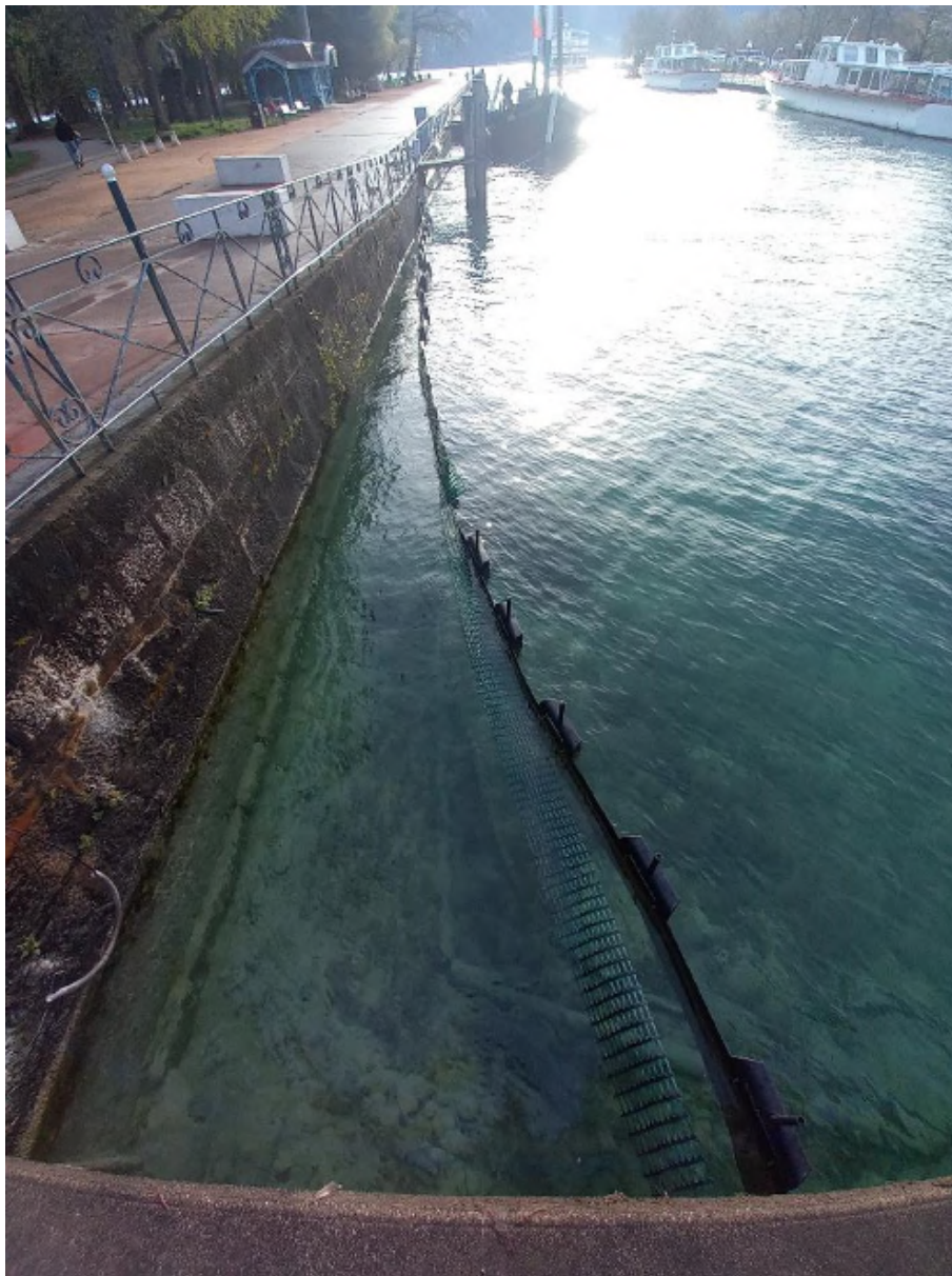
7 – Vue du Quai Napoléon du Canal du Thiou depuis le Pont de la Halle (vue vers l'Est)