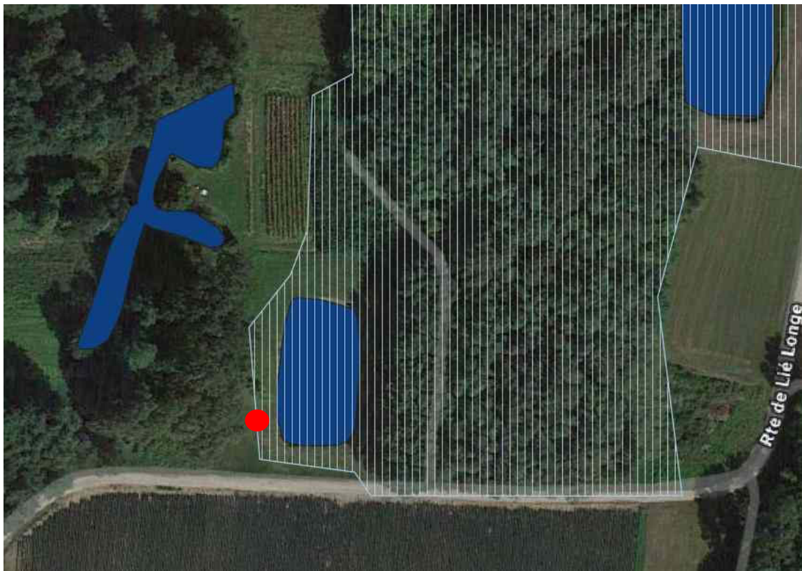
Milieux humides humide selon l'inventaire départemental (hachures bleue) L'emplacement du forage est en rouge

L'expertise des sols a été conduite à partir de 7 sondages pédologiques décrits ensuite