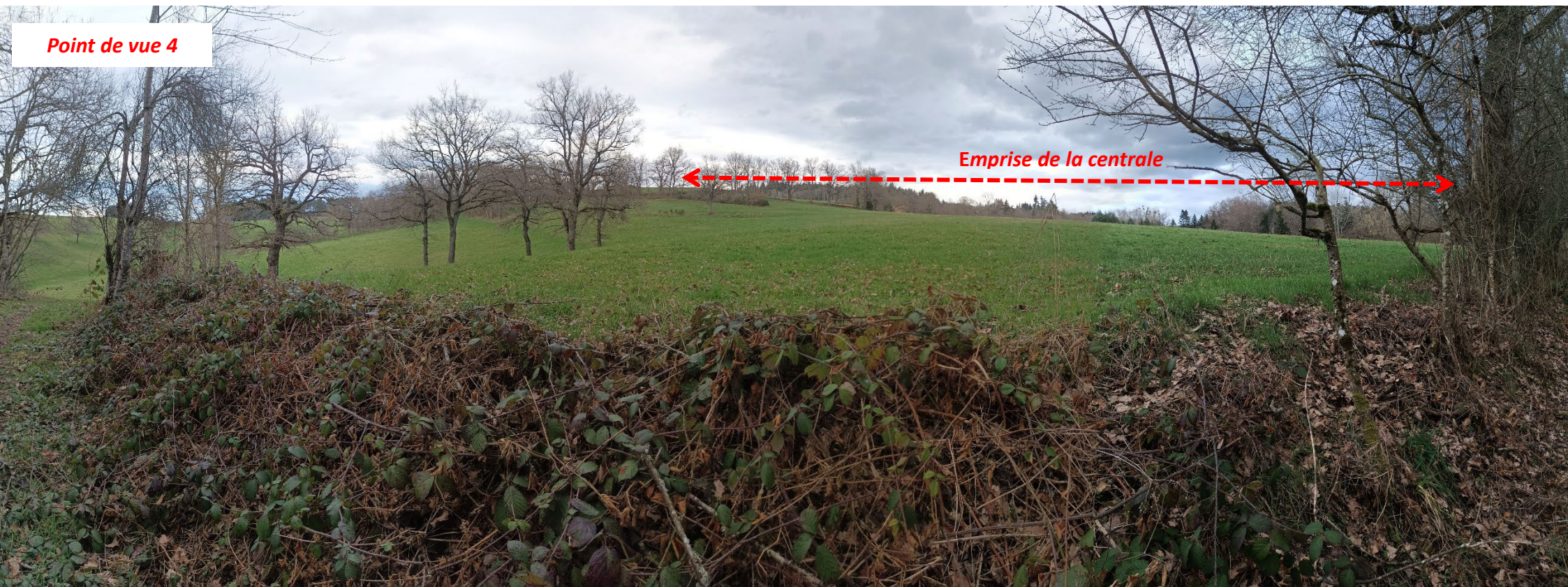
Point de vue 4

Ce point de vue, pris depuis la lisière du boisement à l'Ouest du projet, présente le site d'implantation avant projet. Le projet s'étendra au premier plan de l'image.