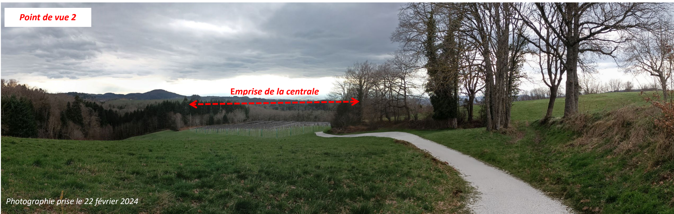
Point de vue 2