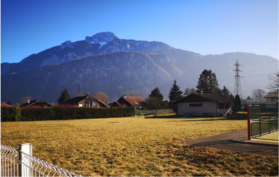
Point de vue 3