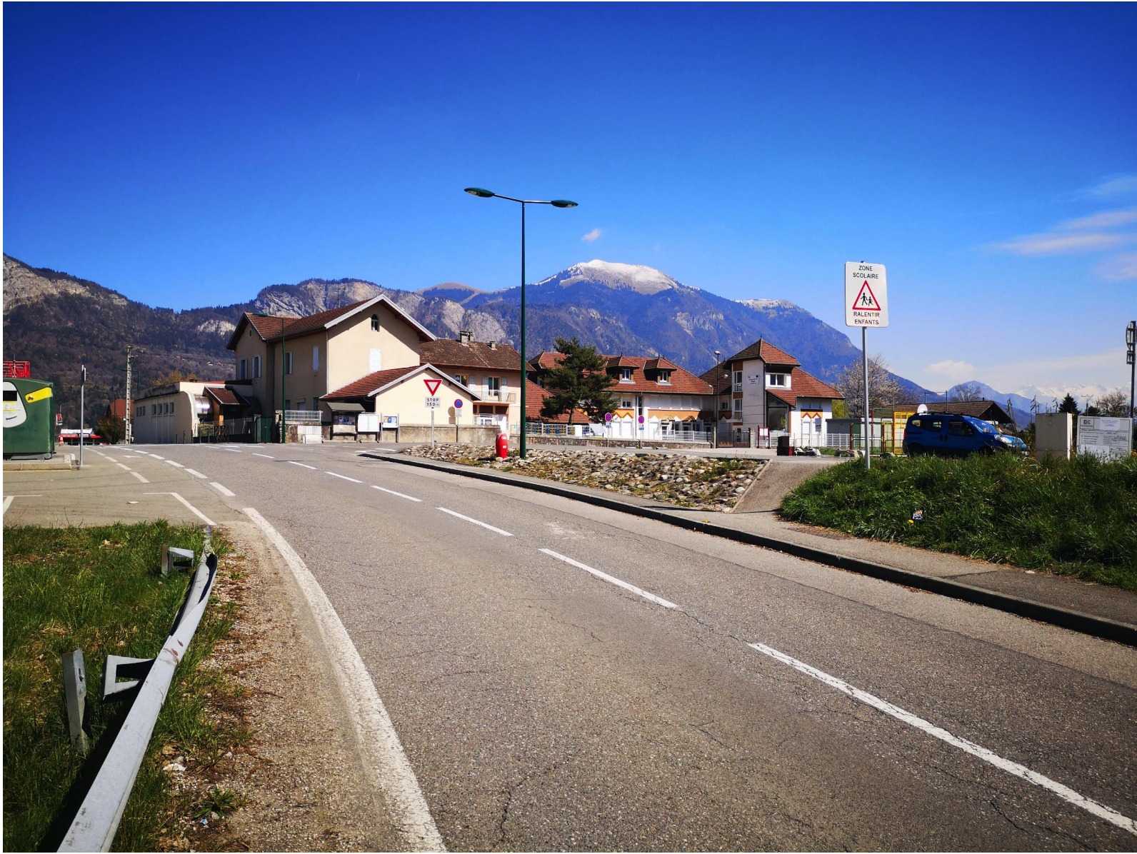
Point de vue 1