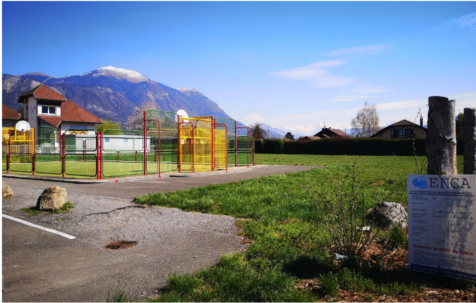
Point de vue 2