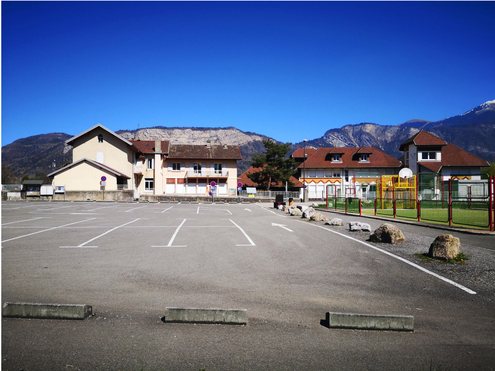
Point de vue 1