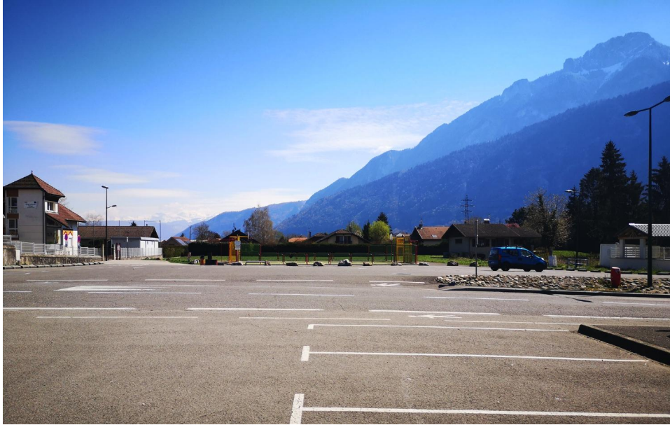
Point de vue 2