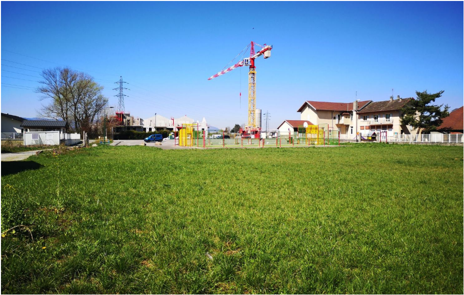
Point de vue 3