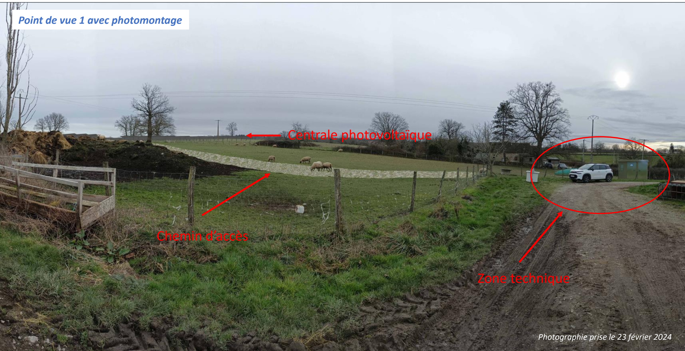
Point de vue 1 avec photomontage