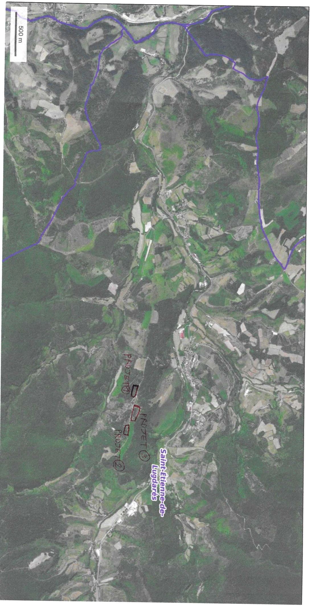
Photo aérienne environ 1/25 000