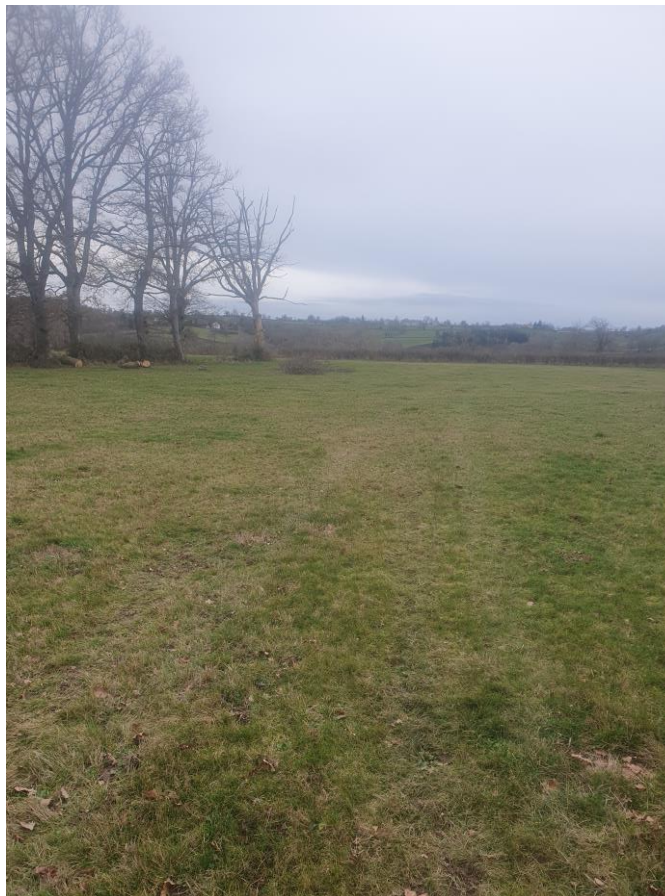
Figure 2 : Photographie 1