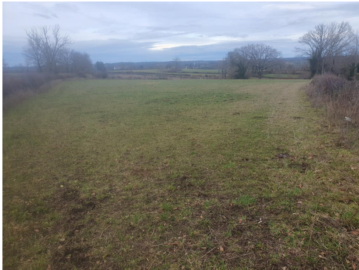
Figure 5 : Photographie 4