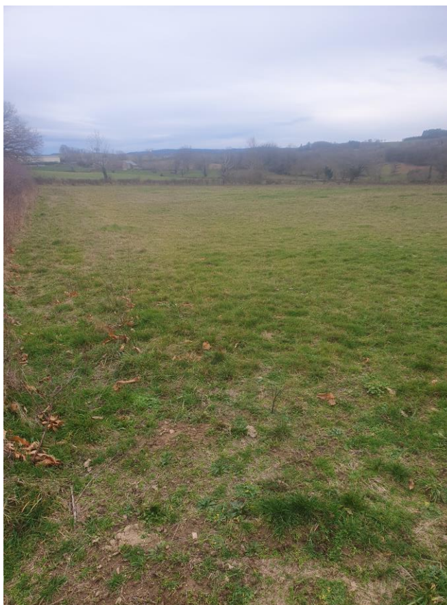
Figure 3 : Photographie 2