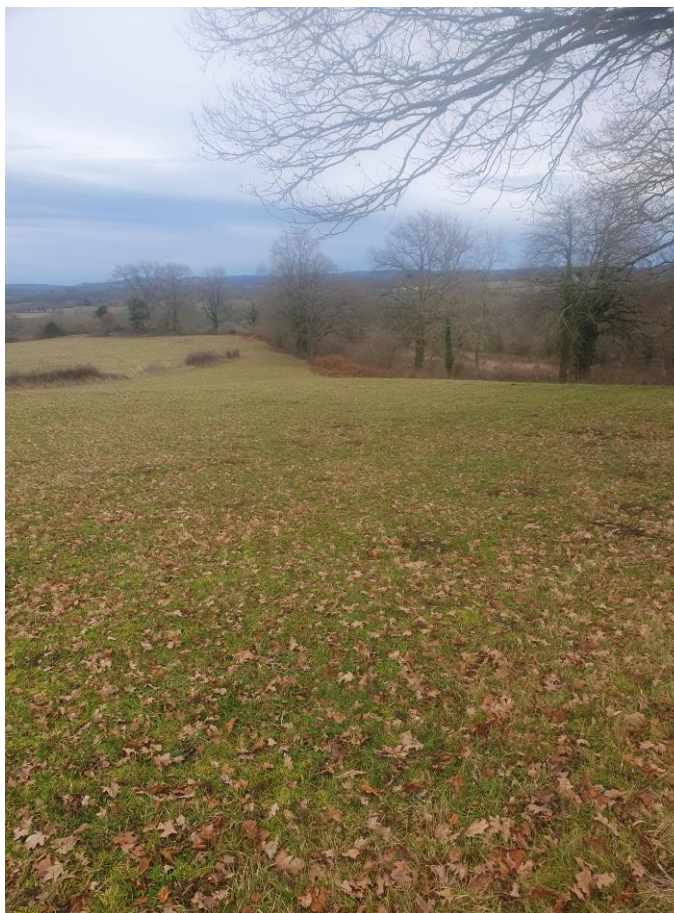
Figure 4 : Photographie 3