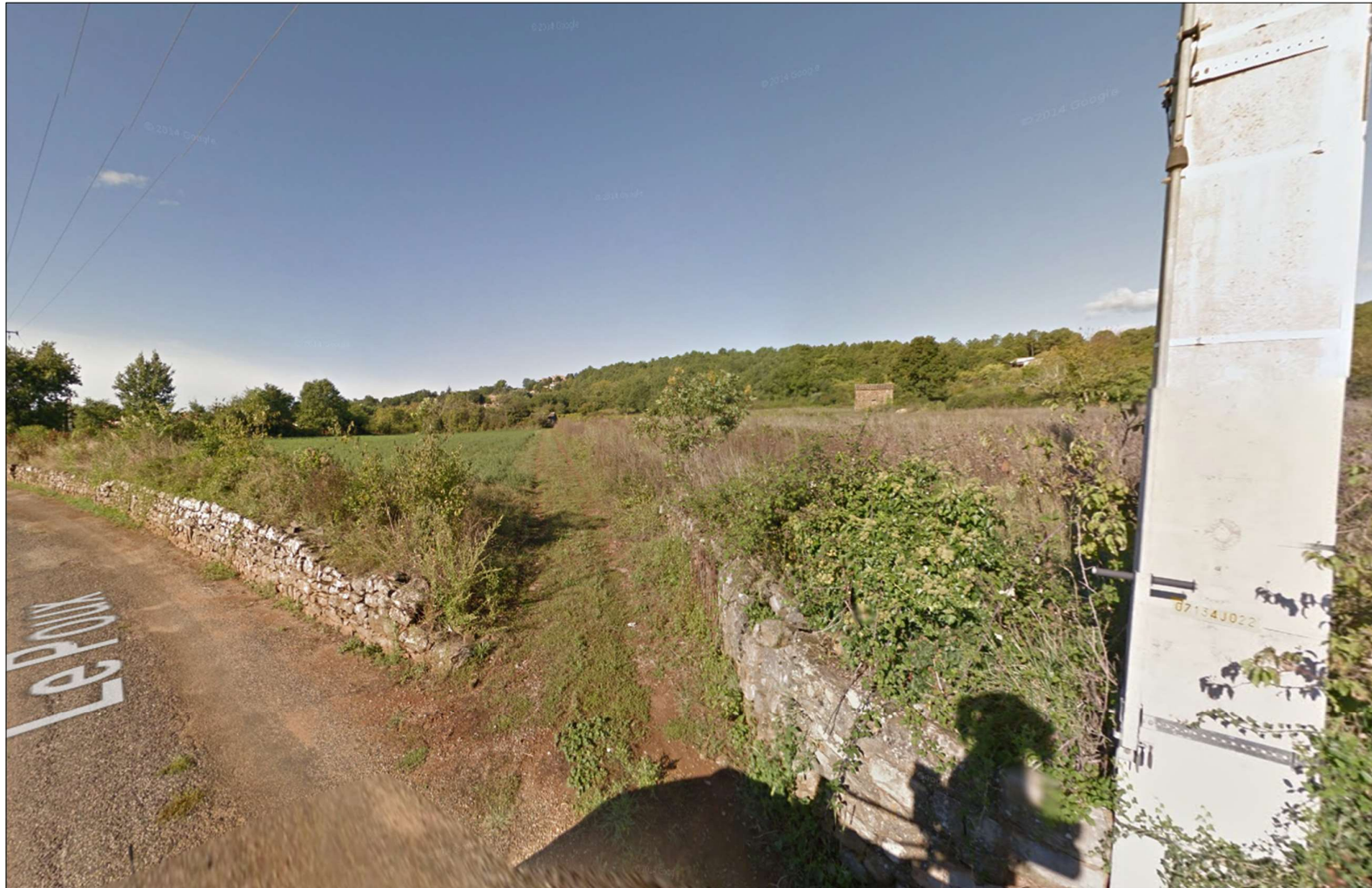
Photographie du site, septembre 2024