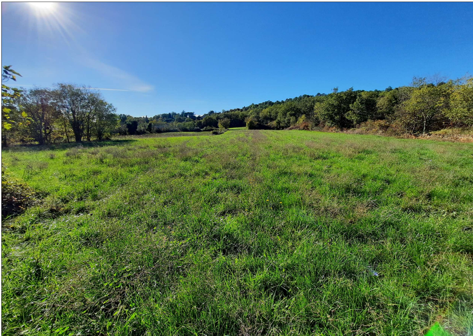
Photographie du site, le 8 novembre 2023