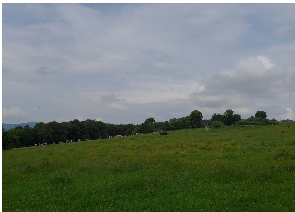
2) Vue depuis le Sud en direction du Nord et du projet de forage