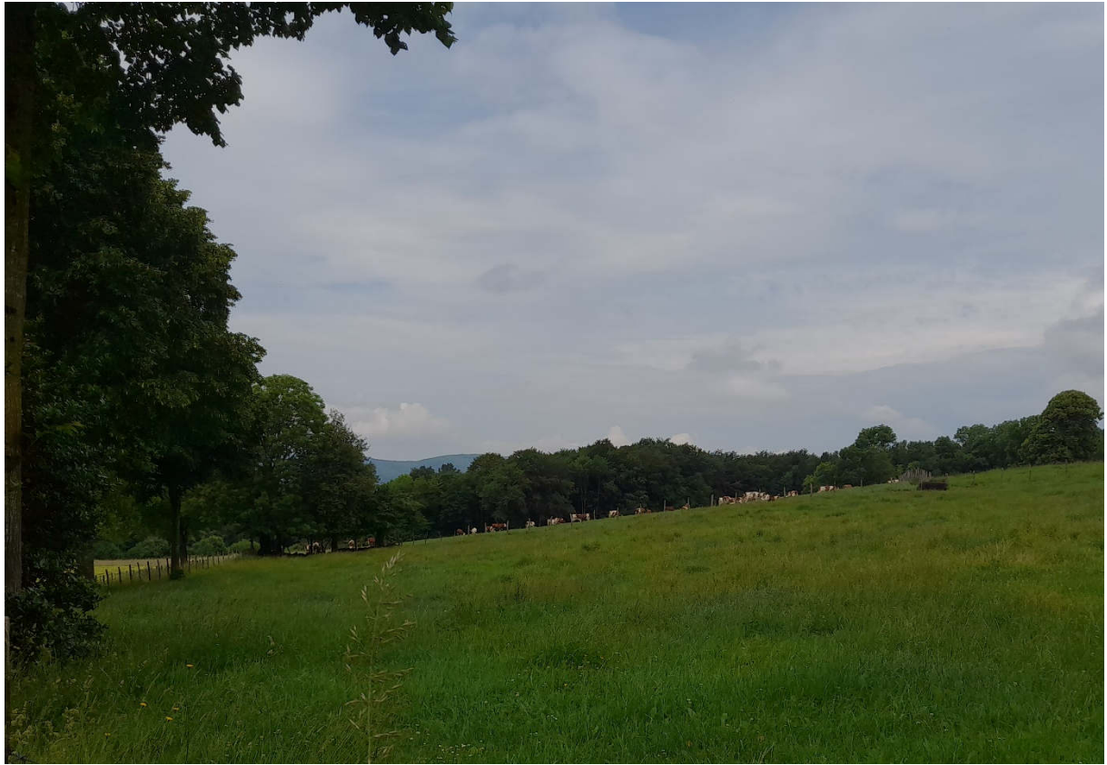
3) Vue vers l'Ouest de la parcelle où sera implanté le forage