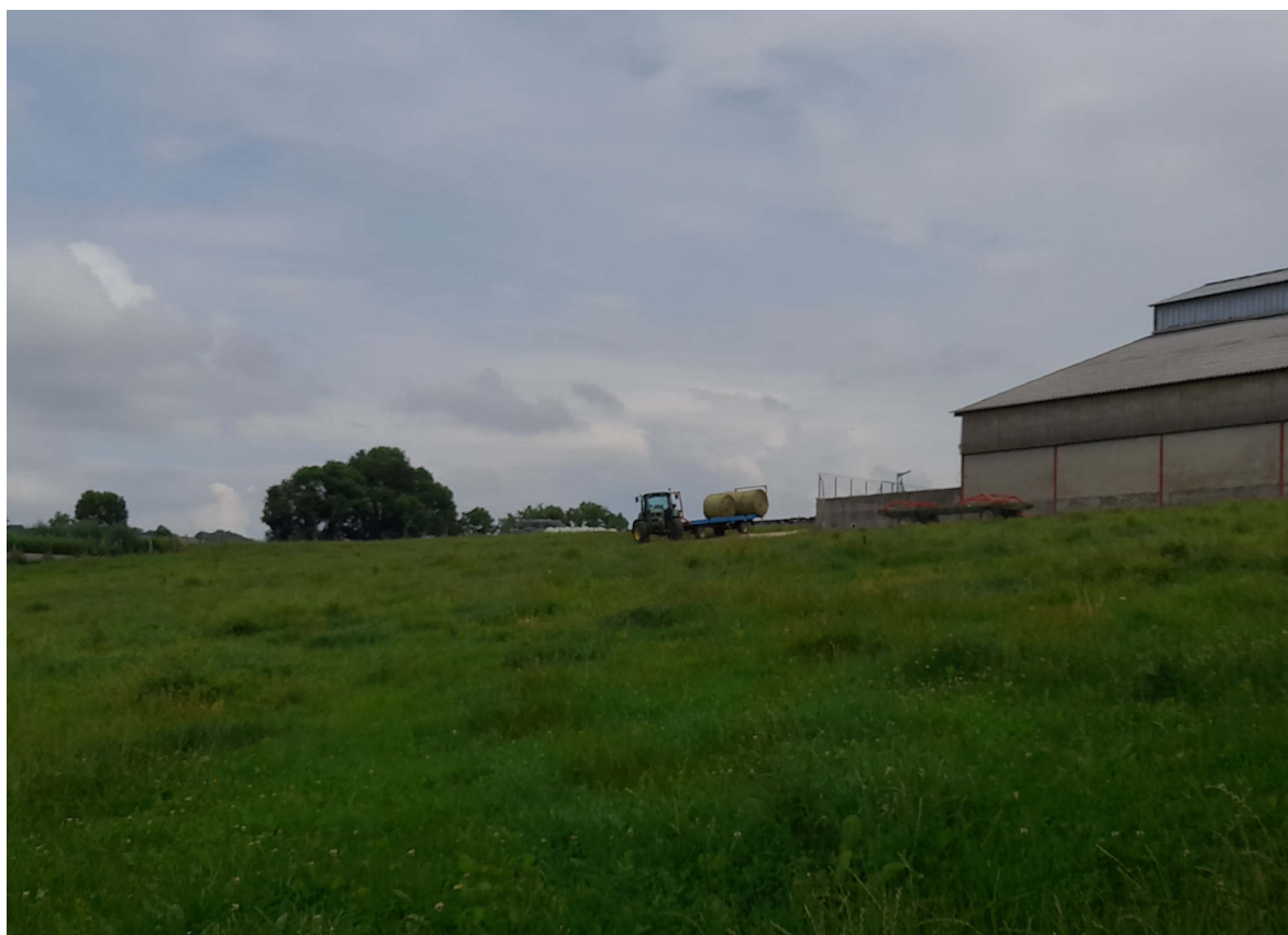
1) Vue depuis le Sud en direction du Nord-ouest, en direction des bâtiments

Toutes les photographies présentes dans ce document ont été prises le 9 Juin 2023