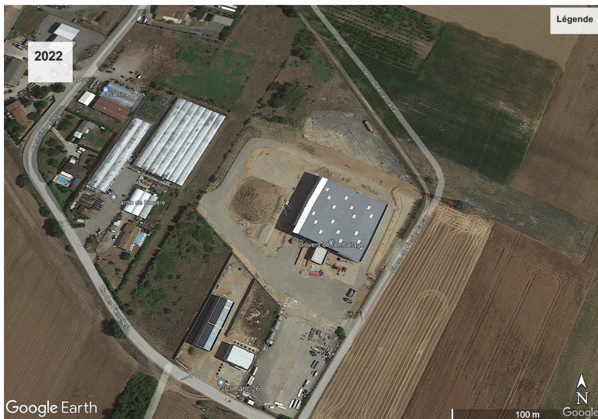
Figure 2 : Évolution de l'aménagement sur le secteur d'extension de la ZA Les Pierrelles entre 1986 et 2022.

- Le plan du projet en annexe n°5 n'est pas légendé et est peu lisible, celui-ci doit être complété merci d'y faire figurer l'ensemble des aménagements créés dans le cadre de l'extension de la ZAE en précisant leur superficie et leur nature. Merci de fournir une insertion paysagère pour apprécier les volumes immobiliers projetés. Est-ce que des espaces verts sont prévus sur les "espaces libres", si oui de quelle nature ?