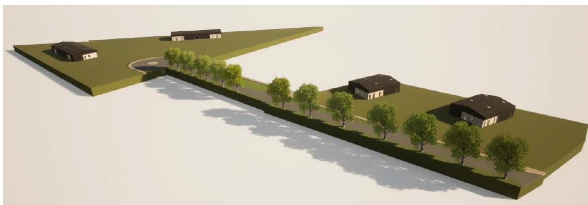
Vue d'ensemble du projet

Est présenté par ailleurs ci-dessous une vue d'ensemble du projet permettant d'apprécier les aménagements paysagers ainsi que les volumes prévus à ce stade.