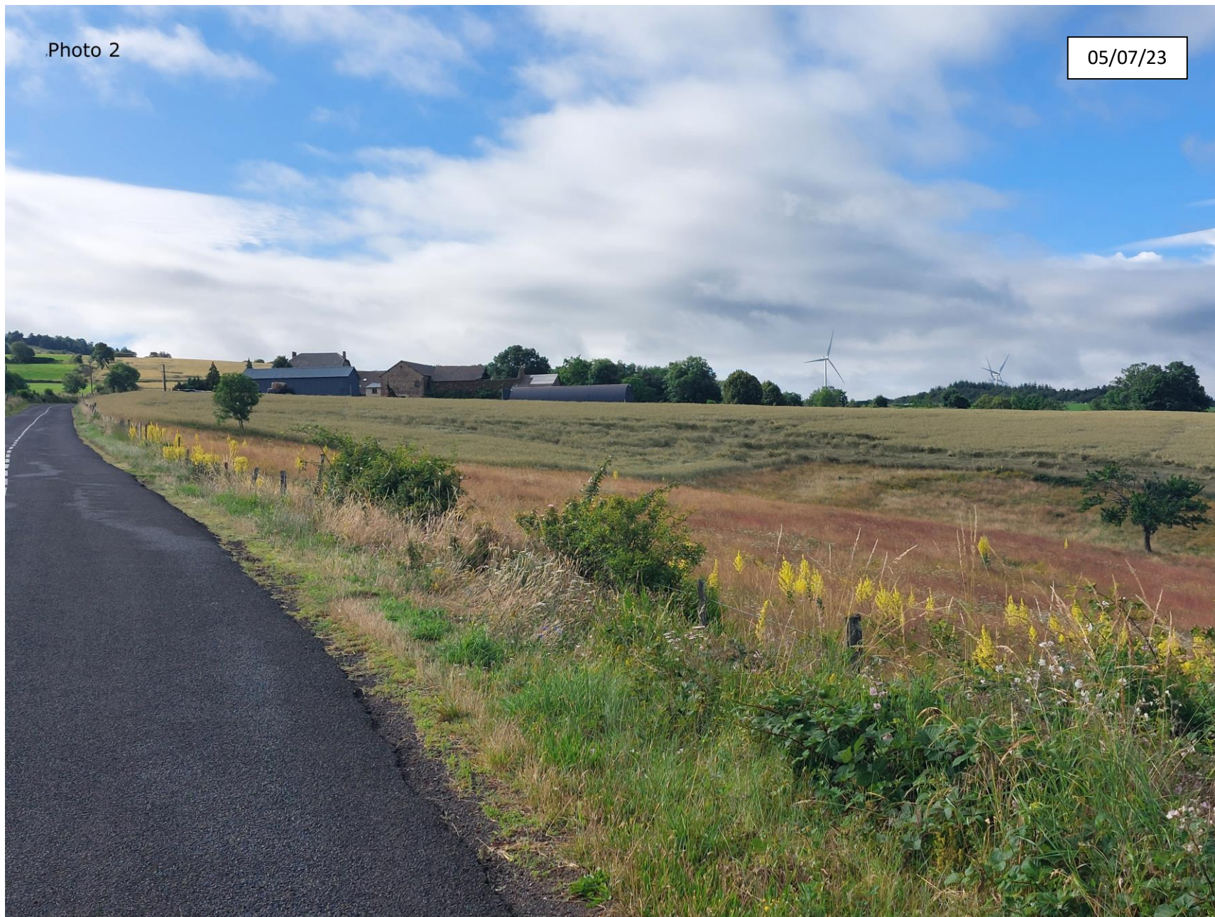
Annexe 4 : Photographie de la parcelle côté Nord (proche)