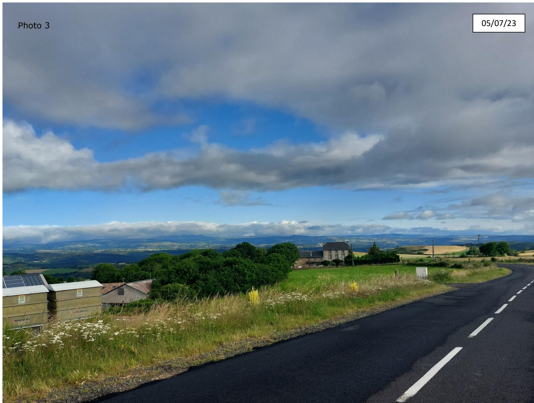
Annexe 4 : Photographie de la parcelle côté Sud