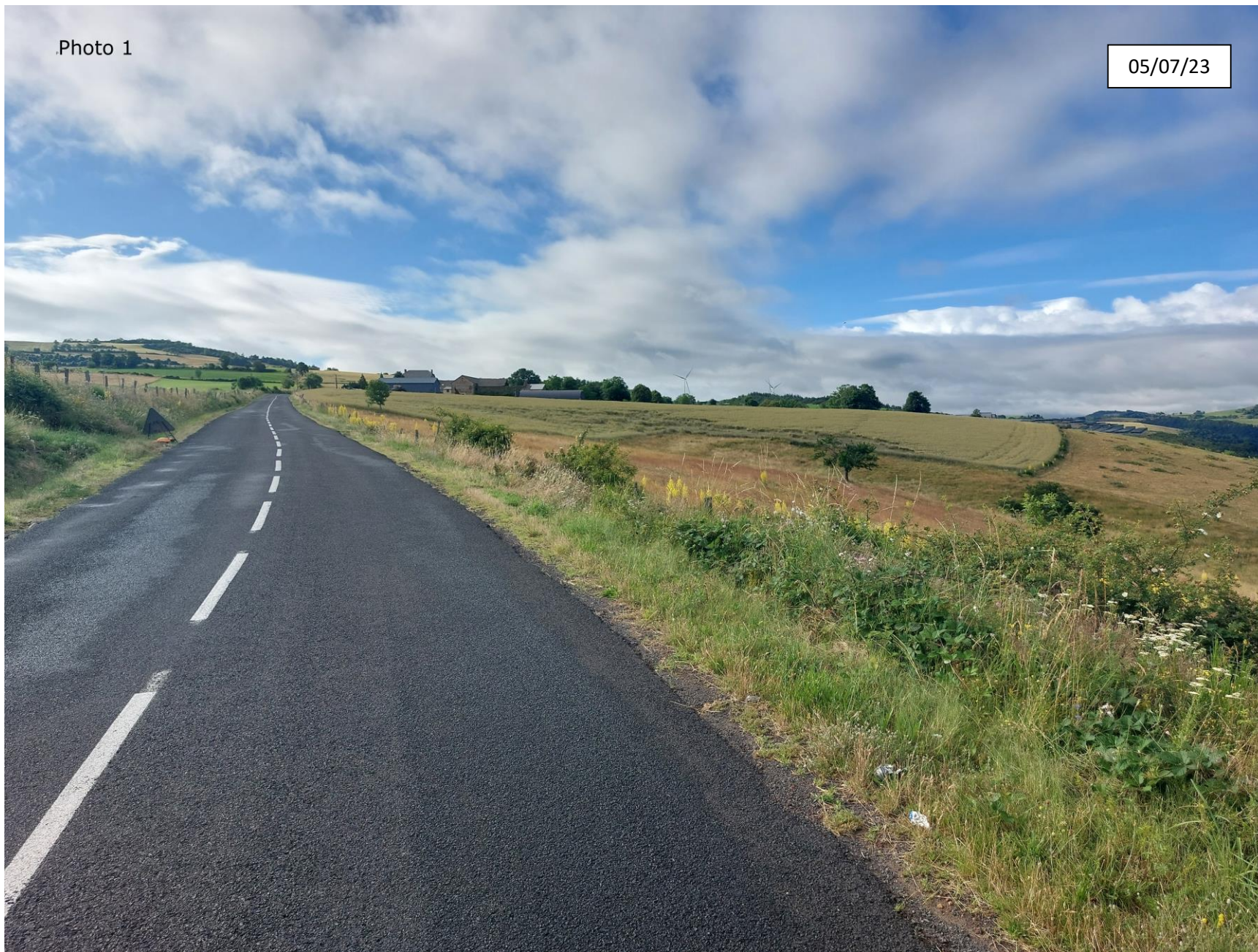
Annexe 4 : Photographie de la parcelle côté Nord (éloignée)