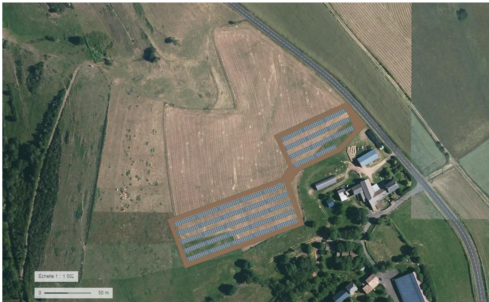
Intégration paysagère du projet