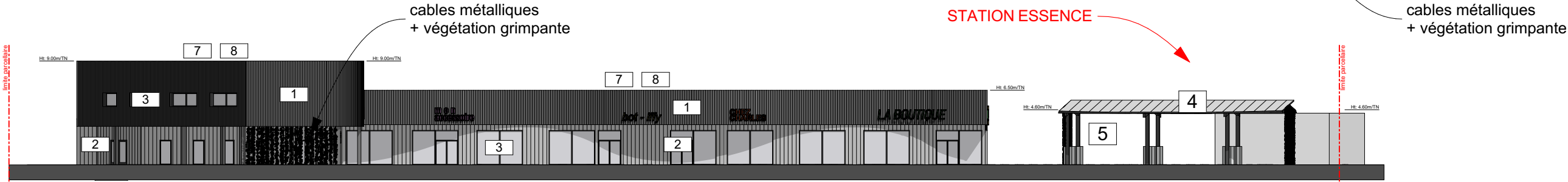
FACADE NORD-OUEST - éch.: 1 / 400°