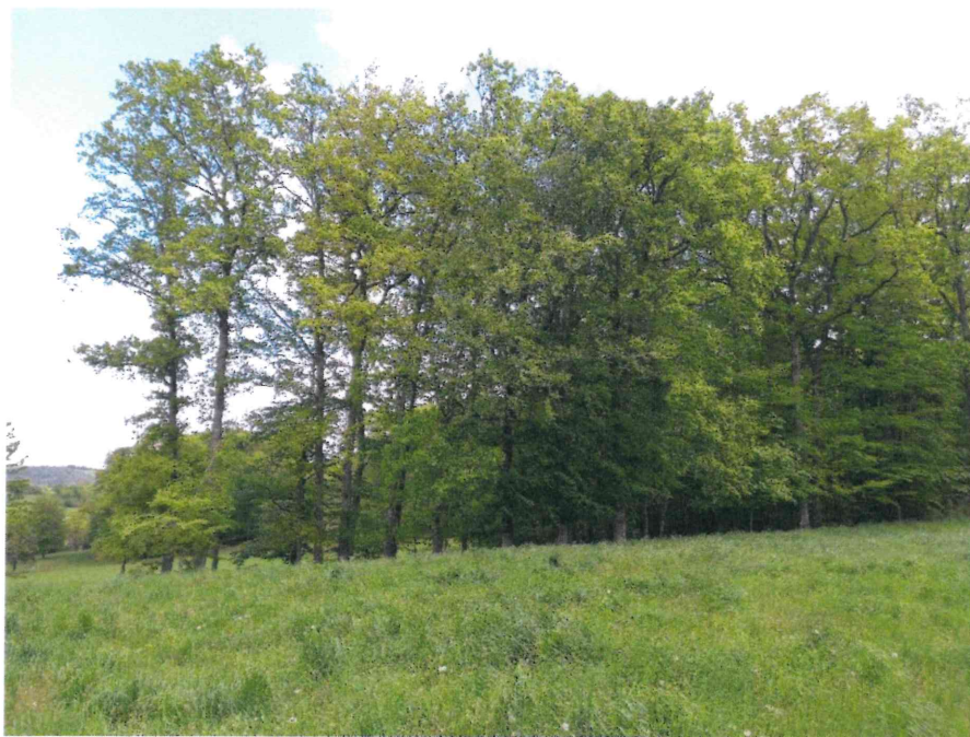
Zone à défricher-déboiser constituée de chênes et hêtres