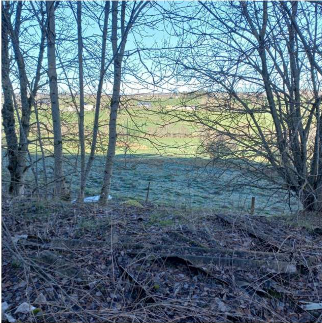
Point de prise de vue hiver 2023 photo 3