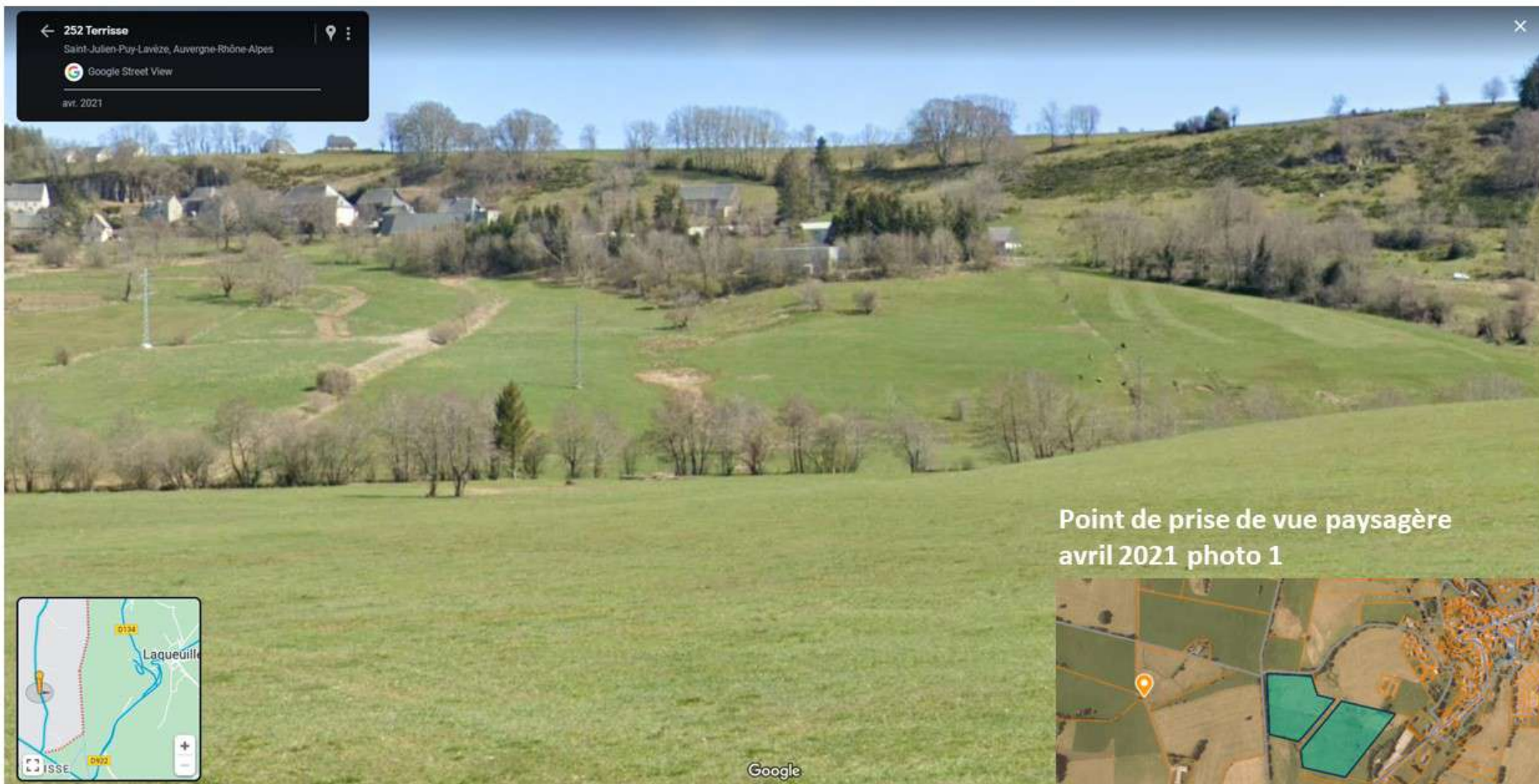
Point de prise de vue paysagère avril 2021 photo 1

← 252 Terrisse Saint-Julien-Puy-Lavèze, Auvergne-Rhône-Alpes Google Street View avr. 2021