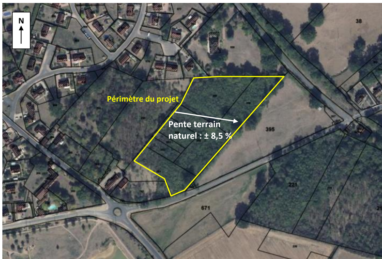
Périmètre du projet (extrait GEOPORTAIL)