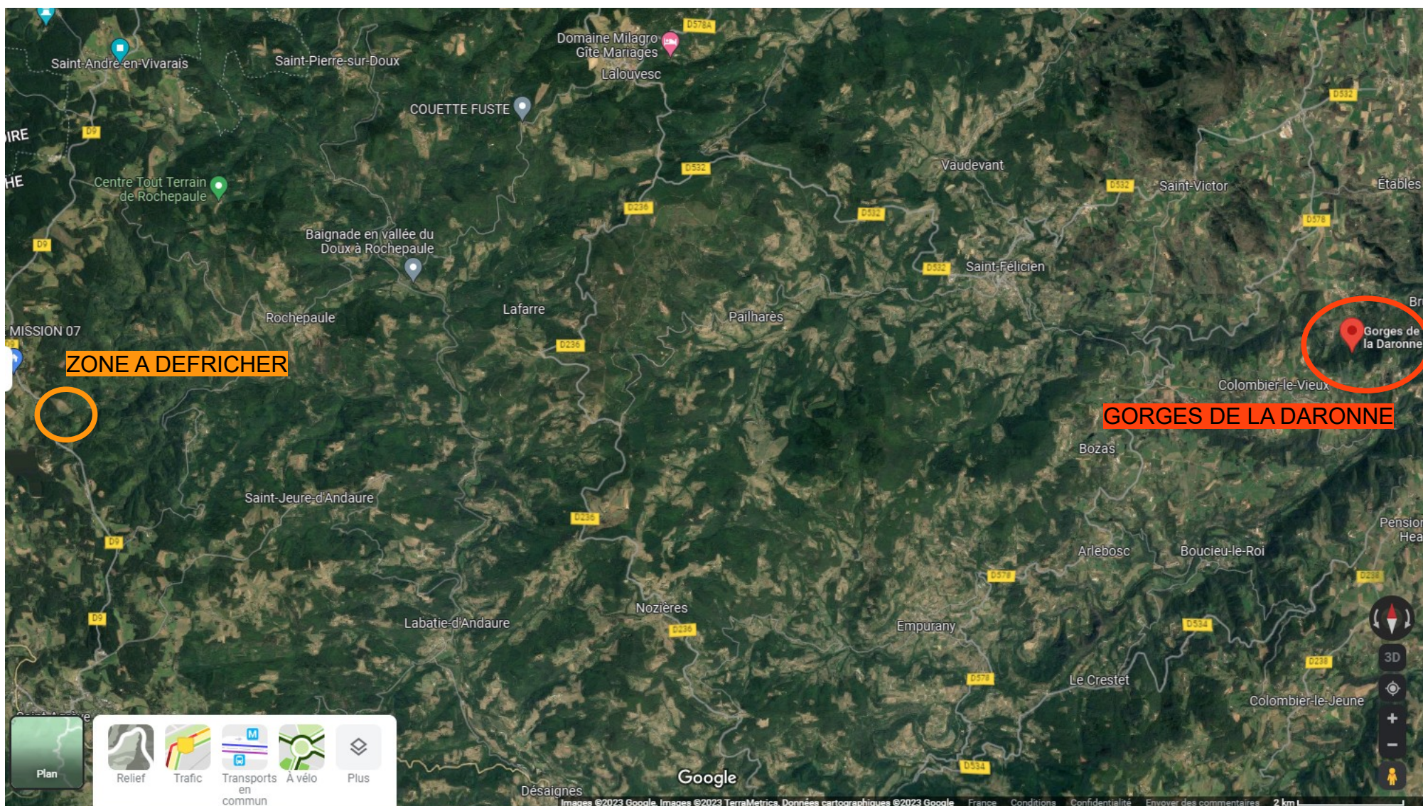
PLAN DE SITUATION PAR RAPPORT AUX GORGES DE LA DARONNE