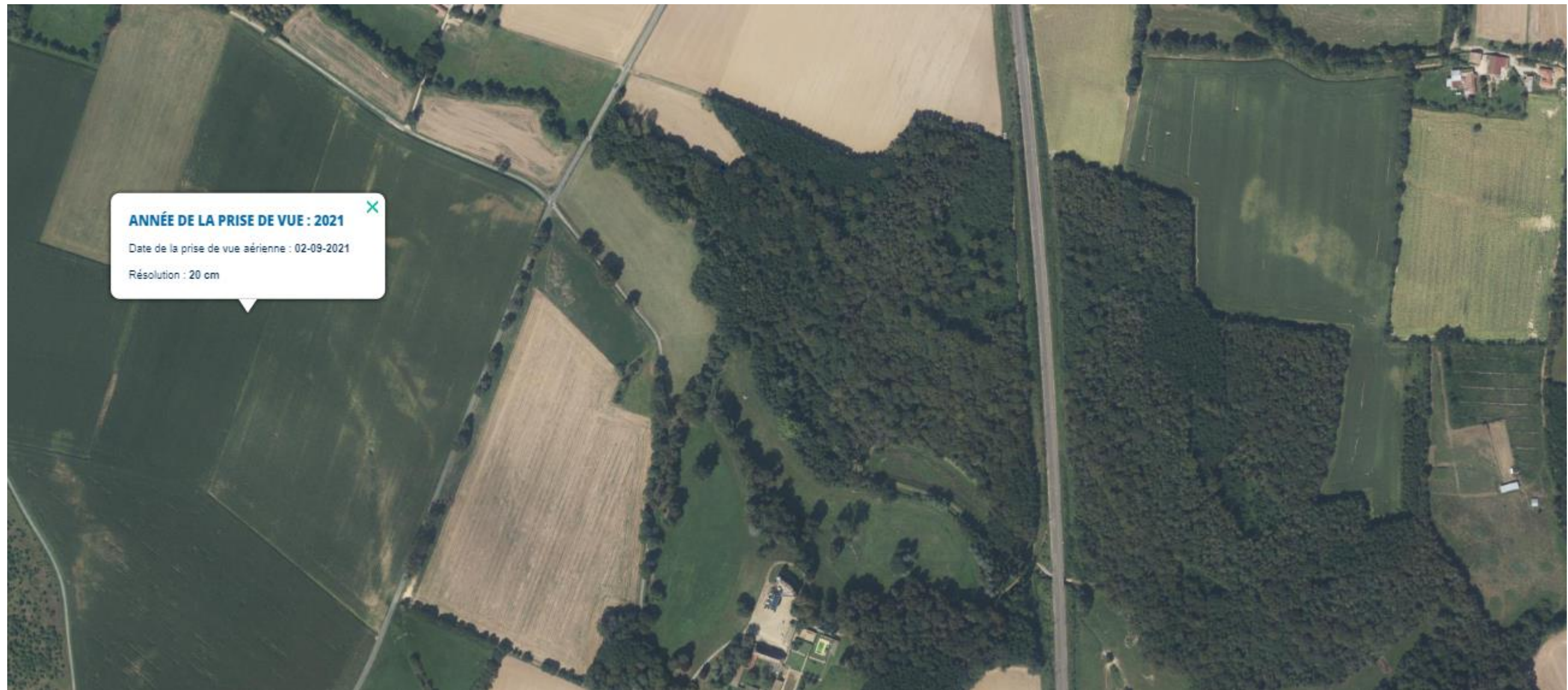
PHOTO 2 : Photographie aérienne (septembre 2021) sans marquage de l'emprise de la zone de défrichement.