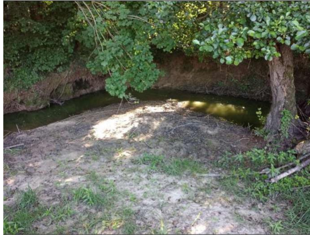
PHOTO 6 et 7 : Photo (août 2022) Bord de Calonne limite zone de défrichement (maintien et restauration de la ripisilve prévu dans le projet de défrichement)