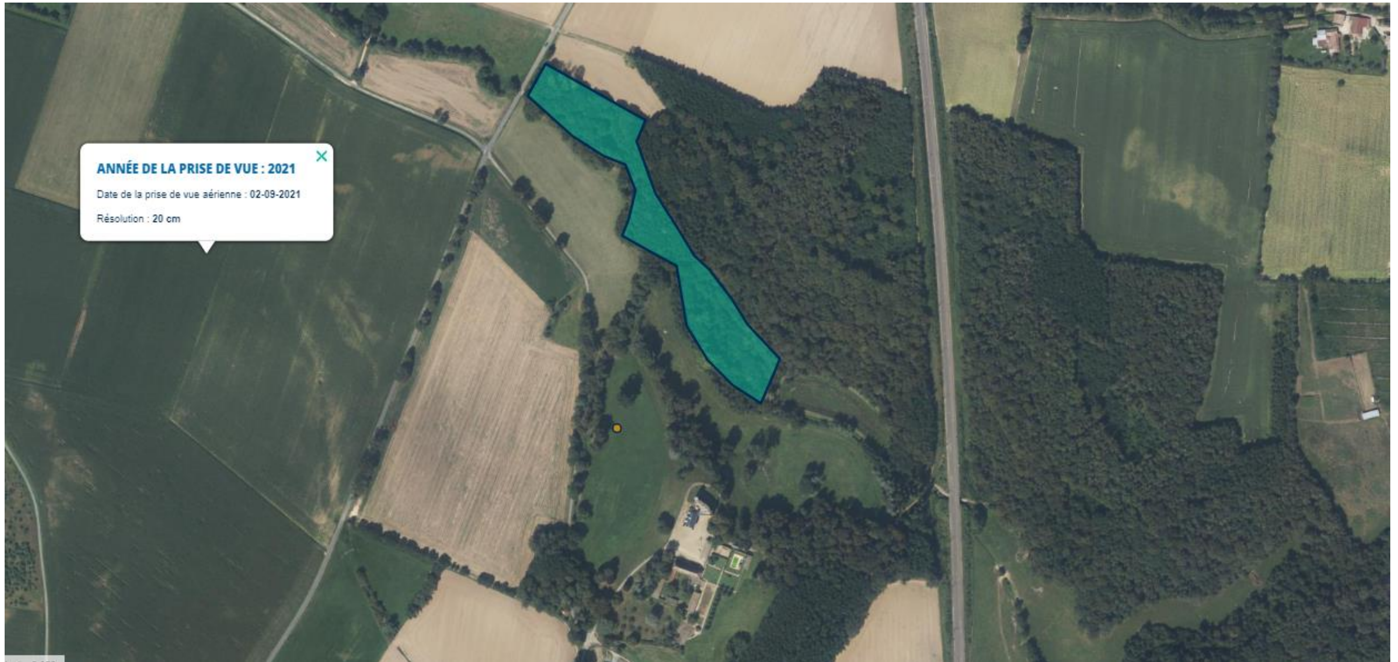
PHOTO 1 : Photographie aérienne (septembre 2021) avec marquage de l'emprise de la zone de défrichement.